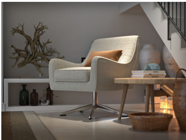
Vida tranquila en Esportes