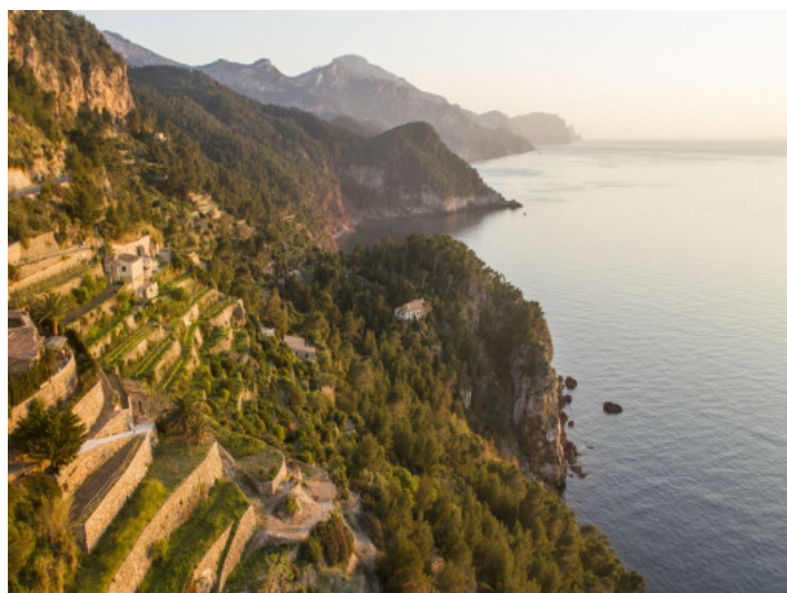
Costa en Bañalbufar