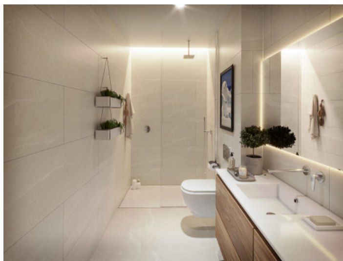
Uno de 2 baños