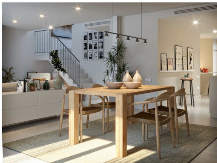
Salón - Comedor

Toda la información como mejor se puede saber, salvo por error durante el periodo de venta. Sirva este documento como un informe previo, las bases legales solo serán válidas a través de un contrato de compra acordado ante Notario.