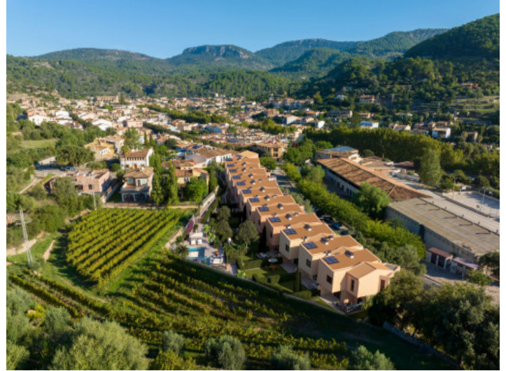
Vista desde arriba