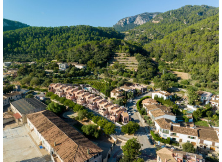
Vista desde arriba