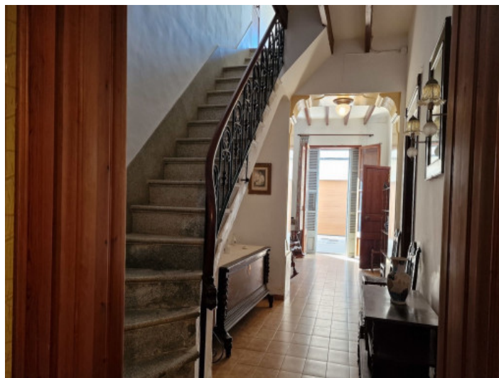
Zona de entrada