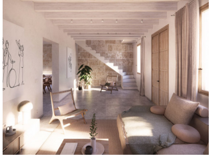
Hall y salón