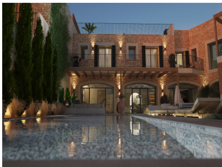
Piscina y jardín