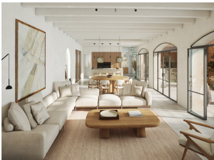
Salon - Comedor