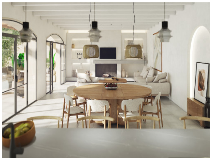
Salon - Comedor

Toda la información como mejor se puede saber, salvo por error durante el periodo de venta. Sirva este documento como un informe previo, las bases legales solo serán validas a traves de un contrato de compra acordado ante Notario.