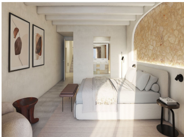
Uno de 4 dormitorios