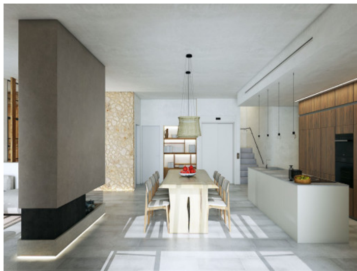
Comedor - Cocina