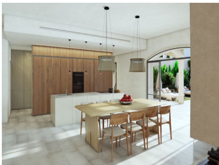
Comedor - Cocina