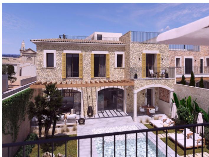
Vistas desde la terraza