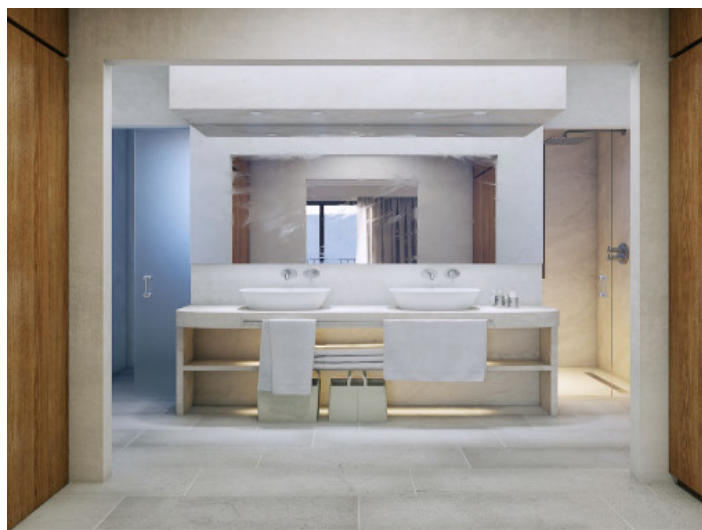
Uno de 4 baños

Toda la información como mejor se puede saber, salvo por error durante el periodo de venta. Sirva este documento como un informe previo, las bases legales solo serán válidas a través de un contrato de compra acordado ante Notario.