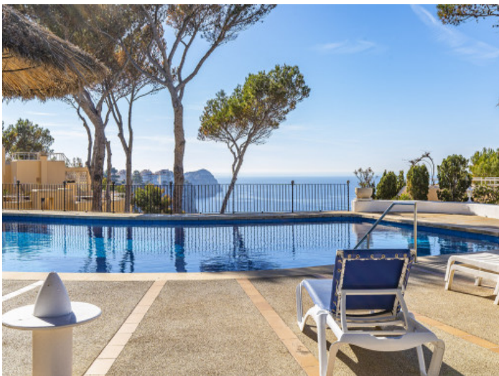
Dúplex con fantásticas vistas al mar en Nova Santa Ponsa