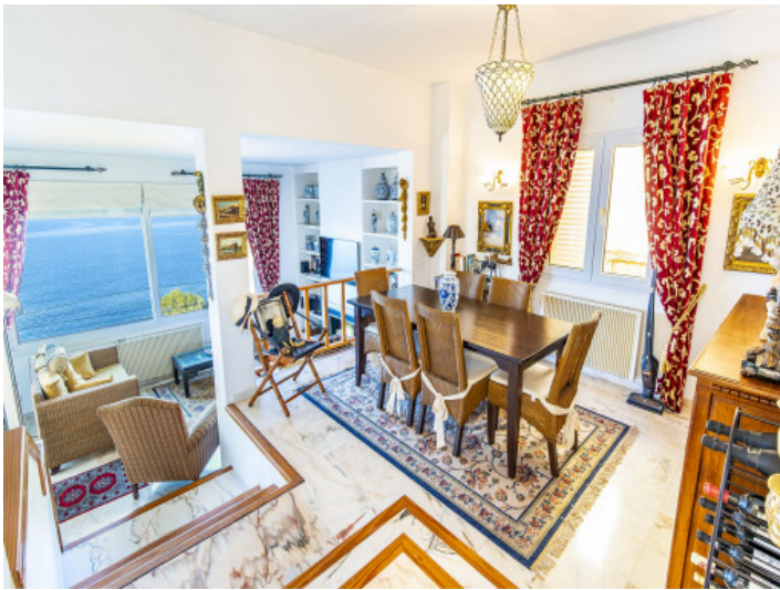
Salon - Comedor