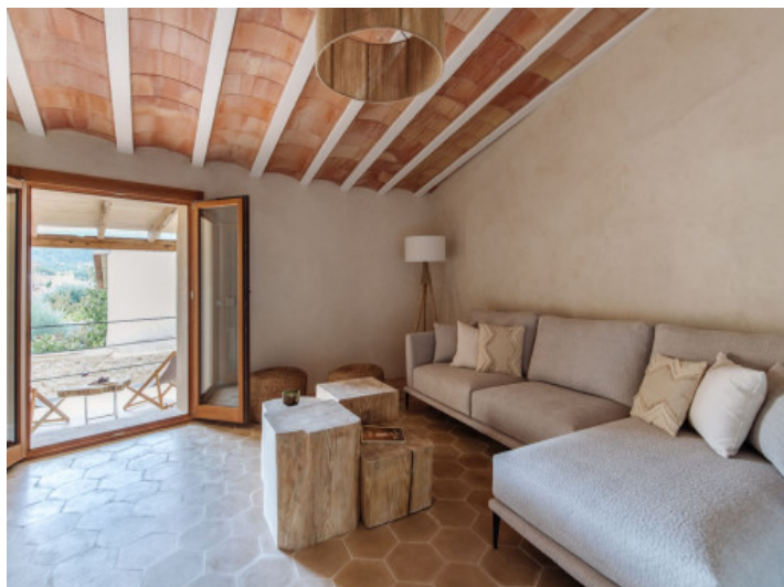
Bonita casa de pueblo reformada en el centro de Alaró