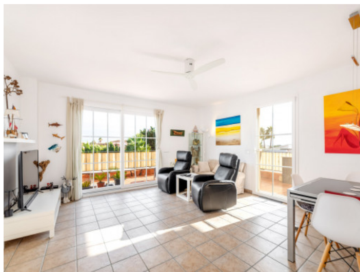
Salón primera planta

Toda la información como mejor se puede saber, salvo por error durante el periodo de venta. Sirva este documento como un informe previo, las bases legales solo serán validas a traves de un contrato de compra acordado ante Notario.