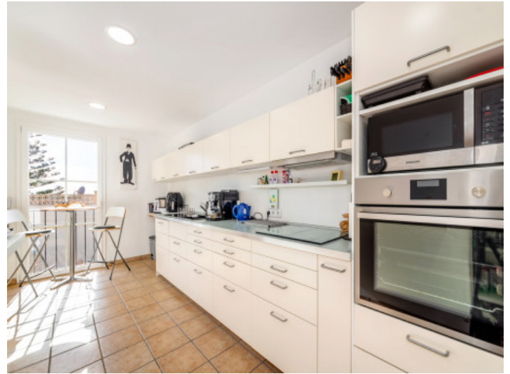
Cocina primera planta