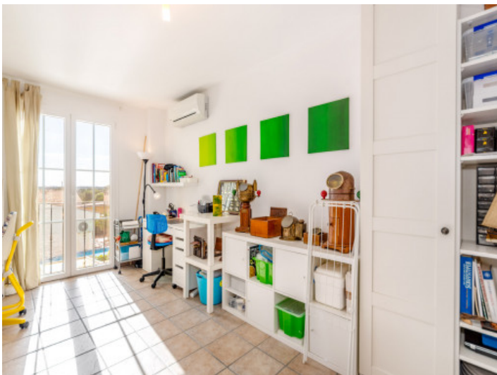
Oficina o cuarto de los niños