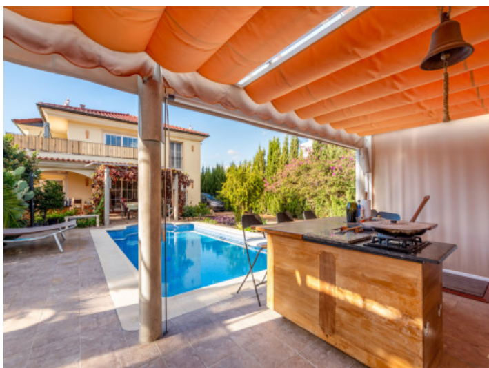
Área de barbacoa