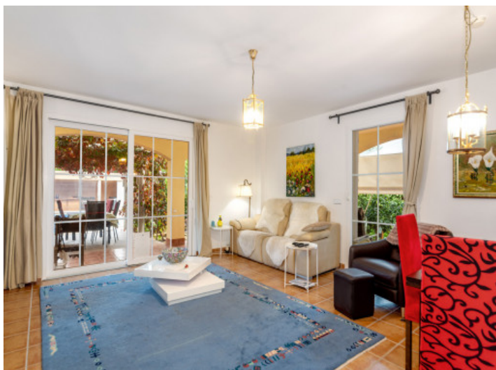
Salón y comedor