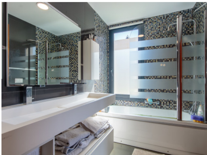
Uno de 3 baños