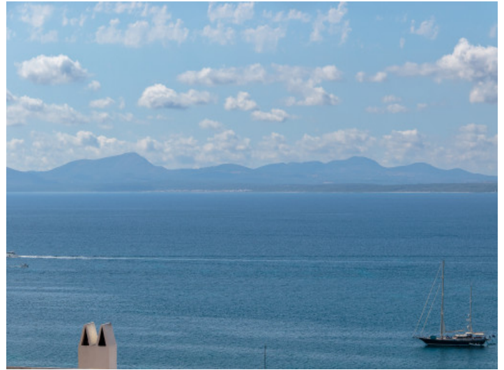
Vistas impresionantes al mar