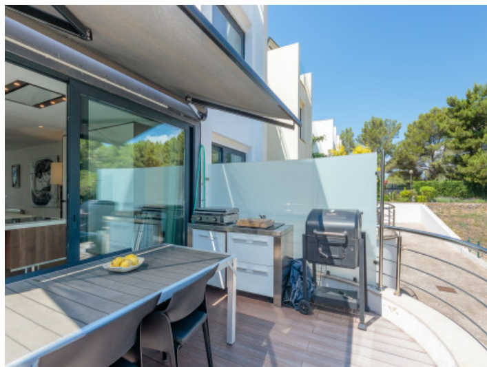
Terraza con zona de barbacoa y tondo