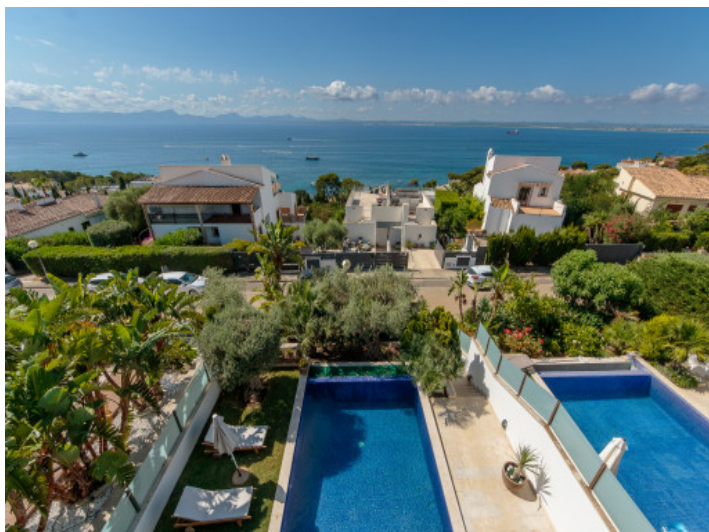
Vistas desde la azotea