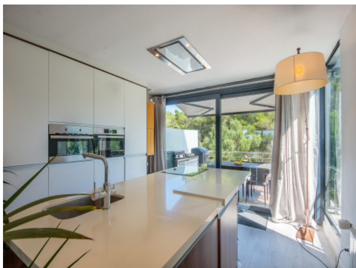
Cocina con isla y salida a una terraza