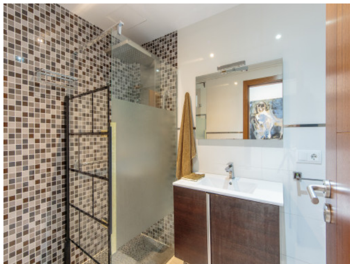
Uno de 3 baños