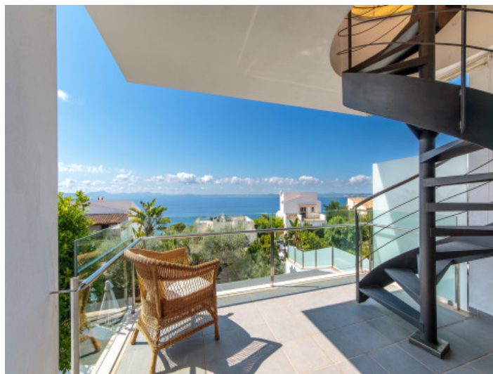
Preciosas vistas lejanas al mar