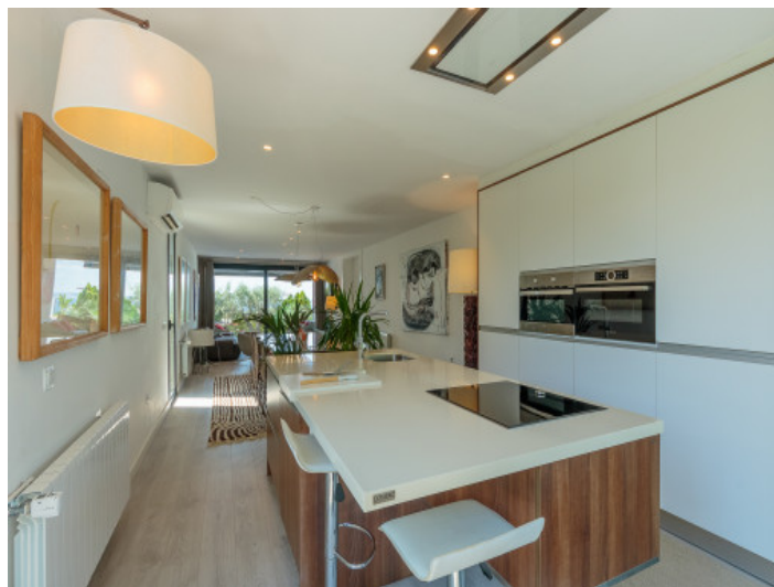
Moderna cocina amueblada