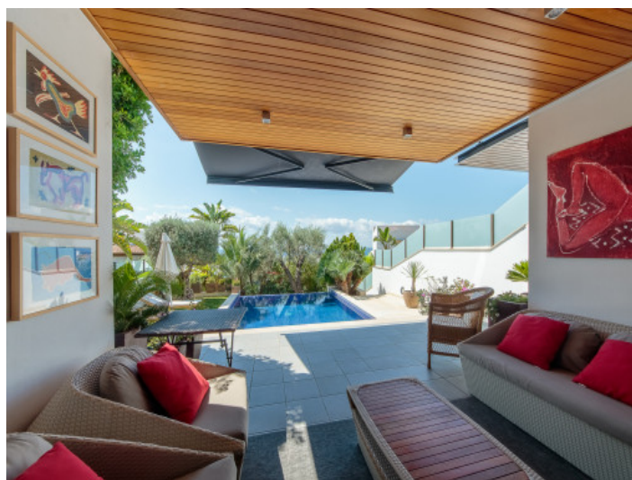
Terraza cubierta con vistas a la piscina