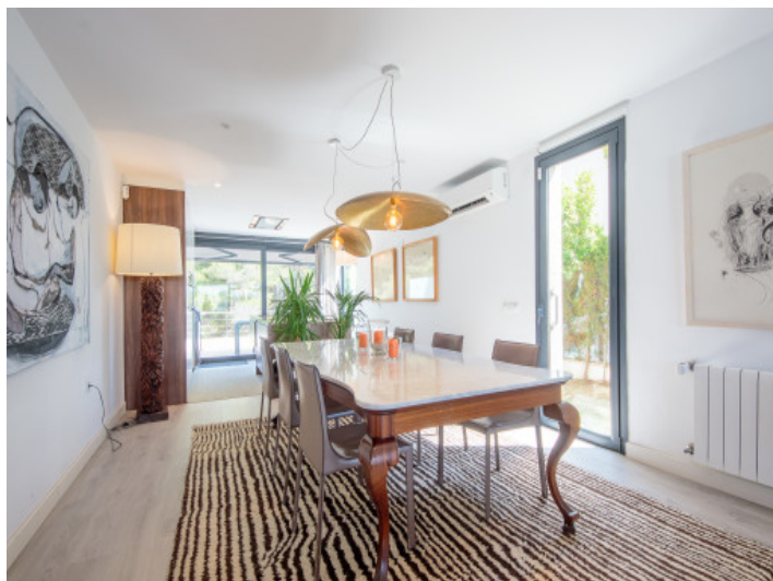
Lujosa zona de comedor