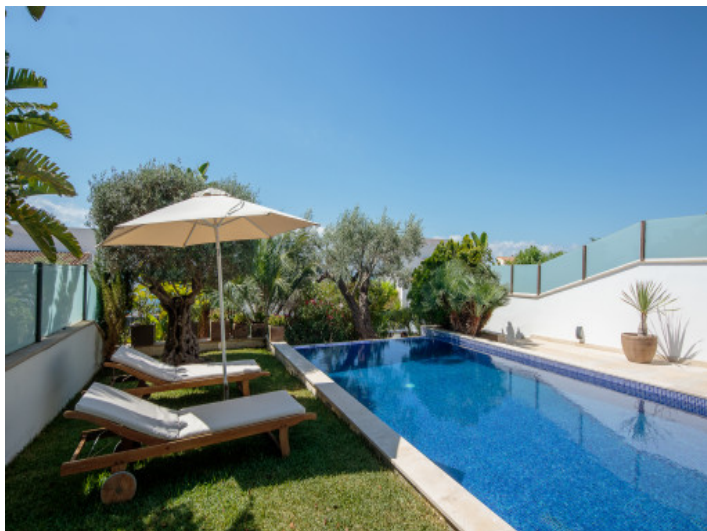
Fabulosa zona de piscina