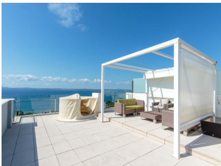
Terraza en la azotea