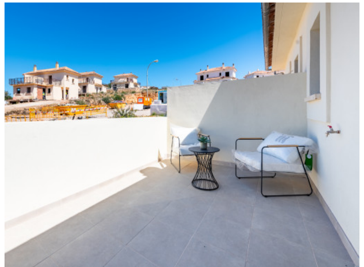
Terraza primero piso