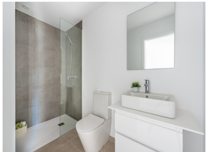
Baño en suite

Toda la información como mejor se puede saber, salvo por error durante el periodo de venta. Sirva este documento como un informe previo, las bases legales solo serán válidas a través de un contrato de compra acordado ante Notario.