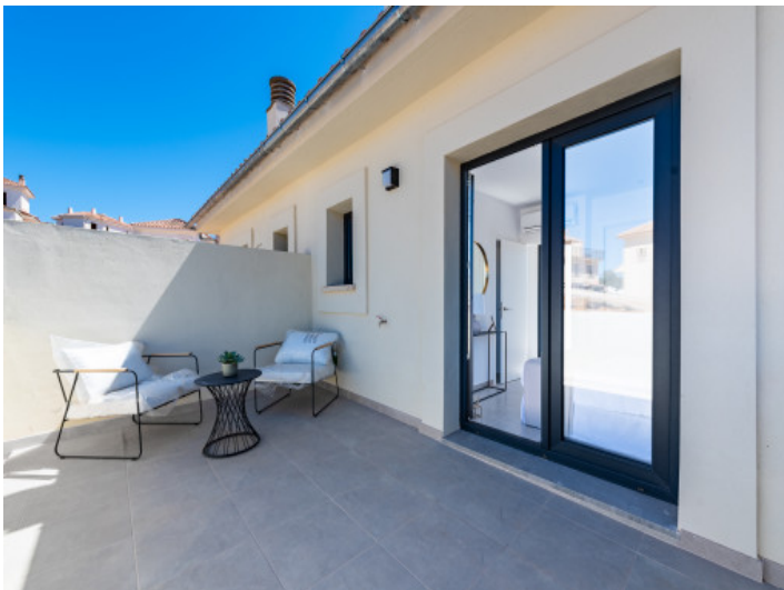
Terraza primer piso