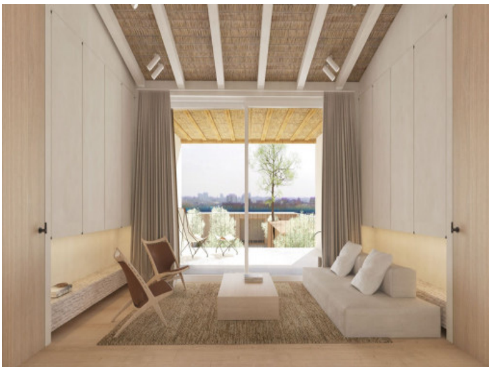
Dormitorio con balcón