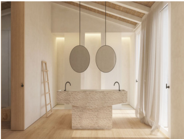
Baño de lujo