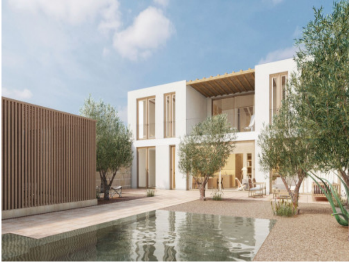
Jardín y piscina