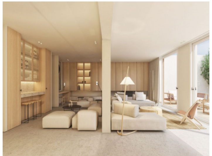
Salón lleno de luz