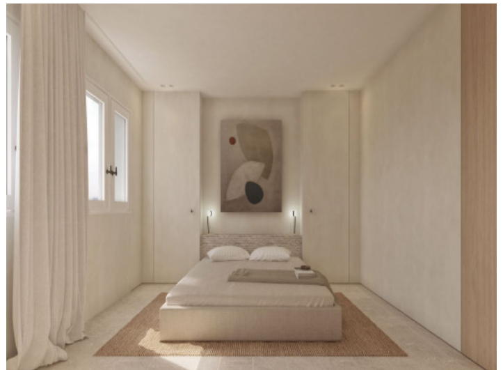
Uno de 5 dormitorios