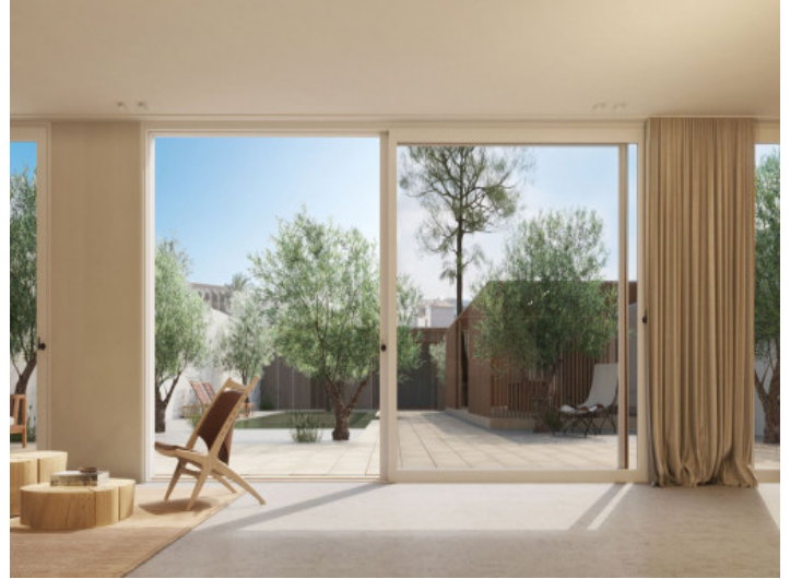
Acceso al jardín