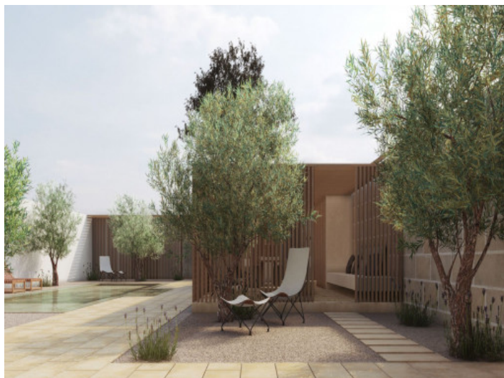
Piscina, gimnasio, casa para los invitados