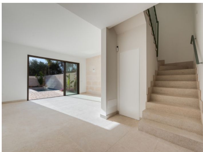
Salón y pasillo