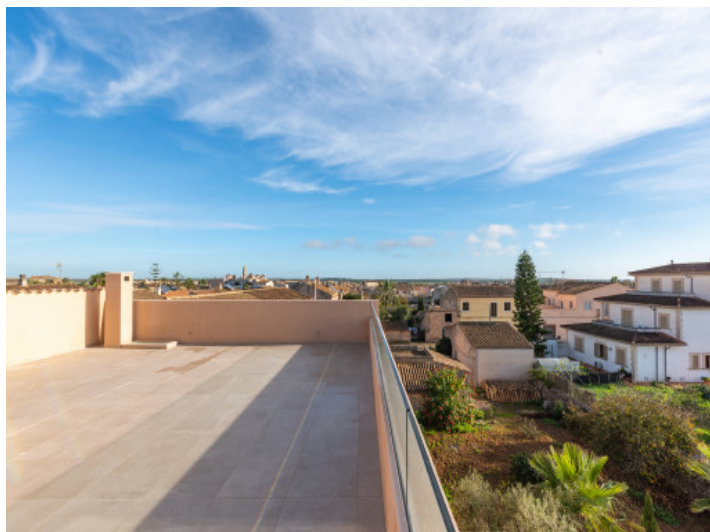
Azotea con una vista