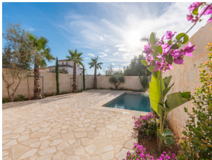
Zona de la piscina soleada