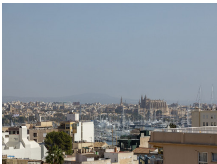
Vista a Palma desde la azotea

Toda la información como mejor se puede saber, salvo por error durante el periodo de venta. Sirva este documento como un informe previo, las bases legales solo serán válidas a través de un contrato de compra acordado ante Notario.