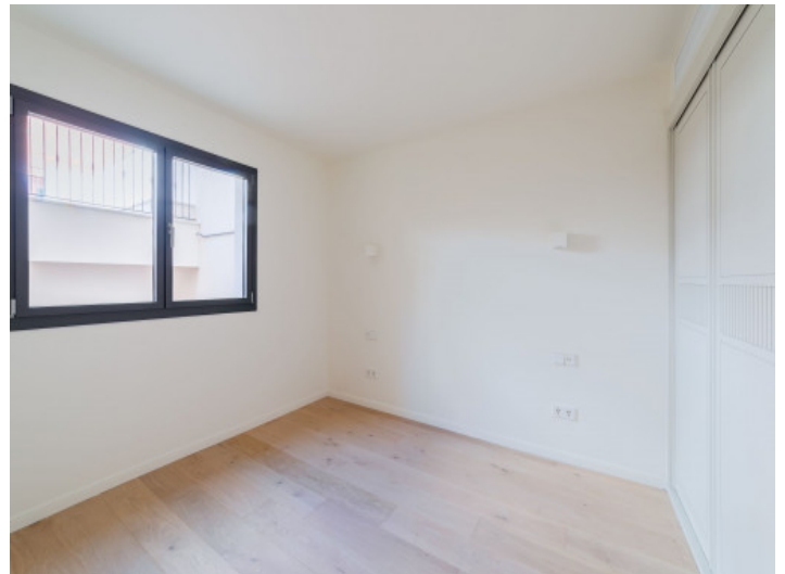
Dormitorio con armario empotrado

Toda la información como mejor se puede saber, salvo por error durante el periodo de venta. Sirva este documento como un informe previo, las bases legales solo serán válidas a través de un contrato de compra acordado ante Notario.