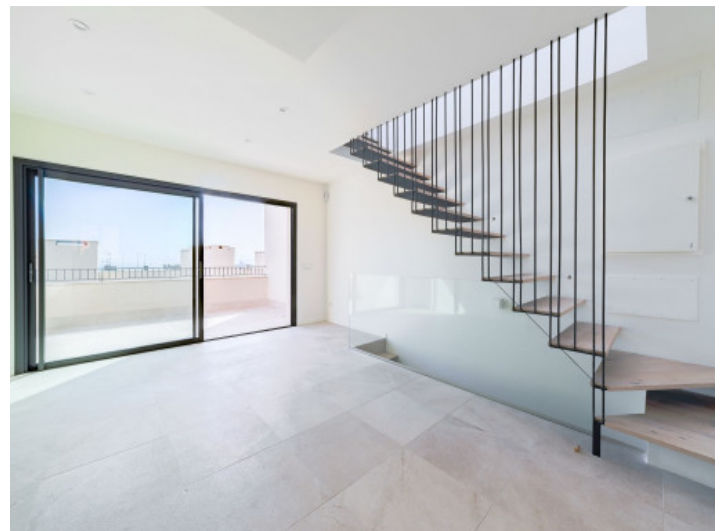
Salón abierto con cocina

Toda la información como mejor se puede saber, salvo por error durante el periodo de venta. Sirva este documento como un informe previo, las bases legales solo serán válidas a través de un contrato de compra acordado ante Notario.