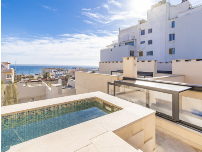
Azotea con jacuzzi