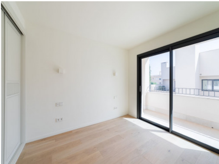
Dormitorio con balcón