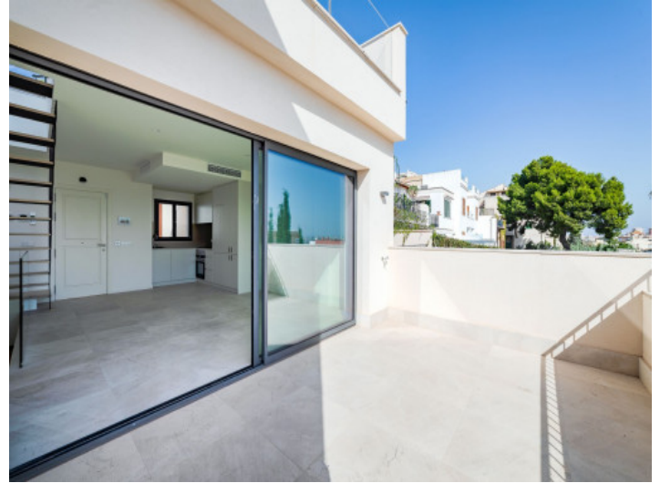
Adosado con terraza en Palma