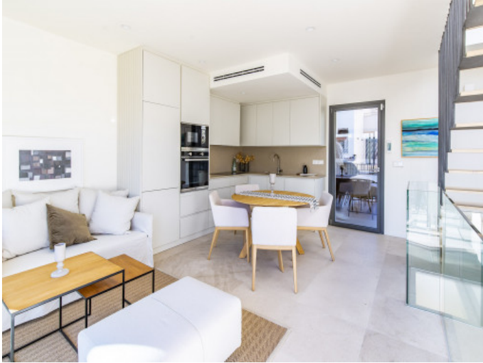
Salon - comedor