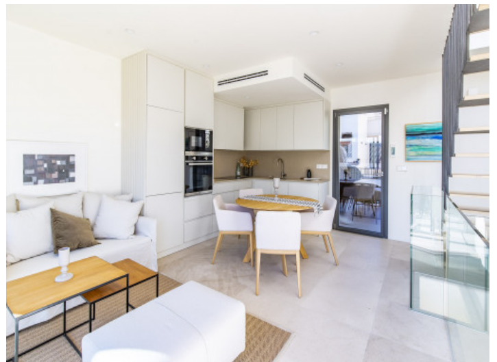
Salon - comedor

Toda la información como mejor se puede saber, salvo por error durante el periodo de venta. Sirva este documento como un informe previo, las bases legales solo serán válidas a través de un contrato de compra acordado ante Notario.