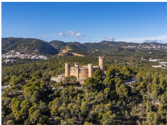
En las cercanías del Castillo Bellver