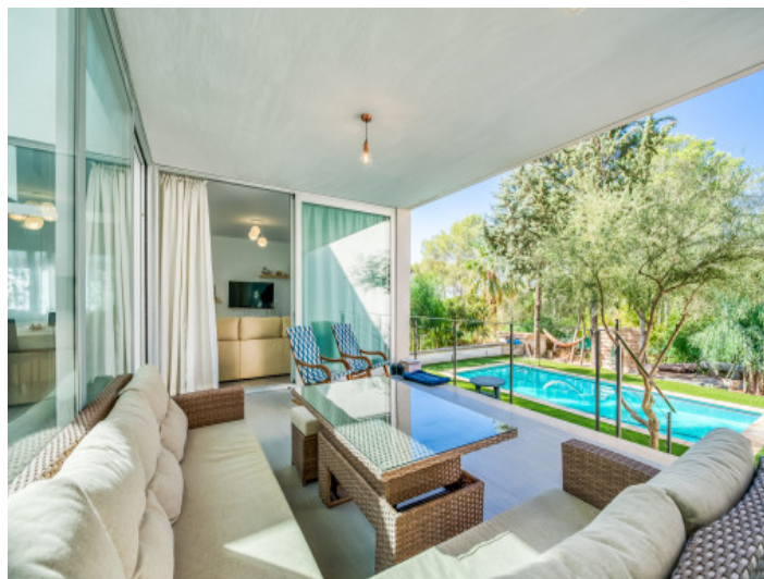
Terraza de lounge