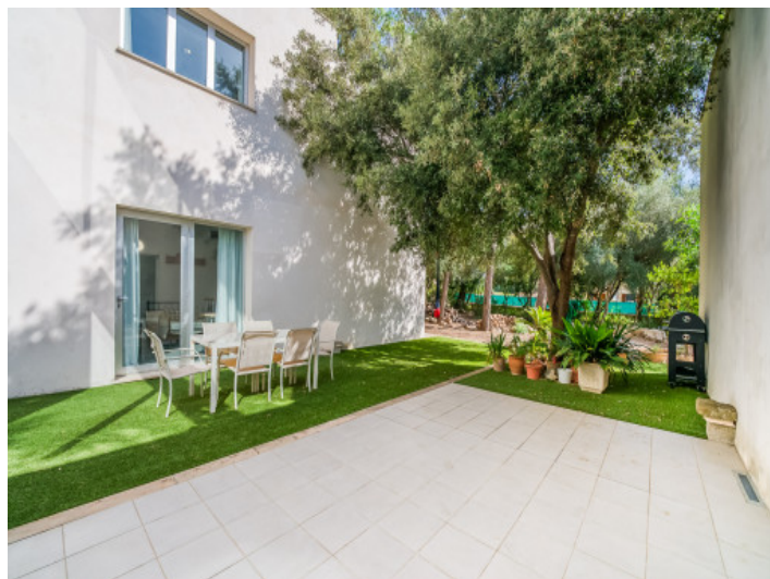
Terraza de la cocina