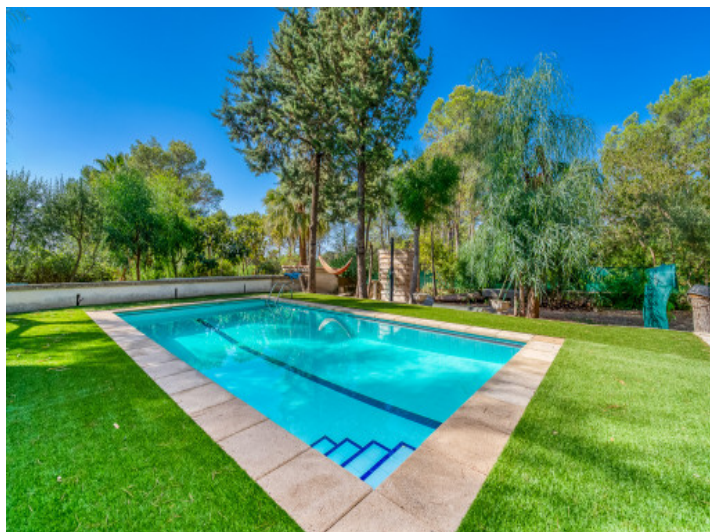
Área de piscina