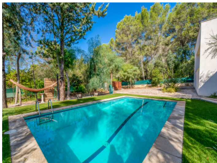
Área de piscina

Toda la información como mejor se puede saber, salvo por error durante el periodo de venta. Sirva este documento como un informe previo, las bases legales solo serán válidas a través de un contrato de compra acordado ante Notario.