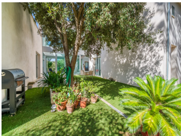
Patio / Terraza