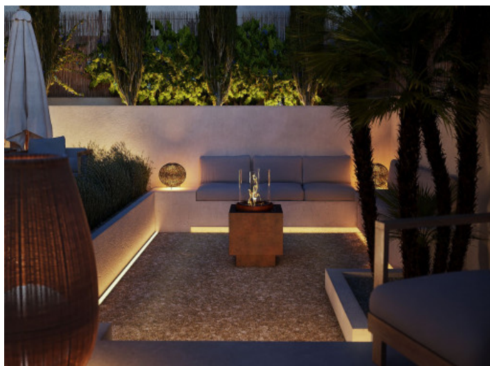
Zona de estar