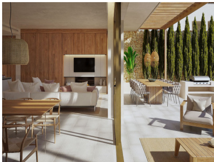
Salón y terraza