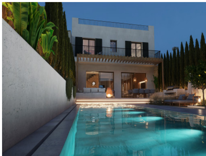
Villa por la noche