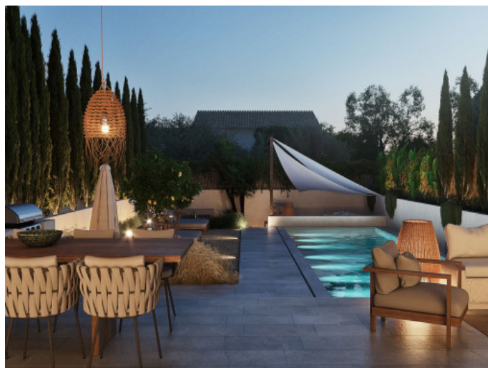
Zona de estar

Toda la información como mejor se puede saber, salvo por error durante el periodo de venta. Sirva este documento como un informe previo, las bases legales solo serán válidas a través de un contrato de compra acordado ante Notario.