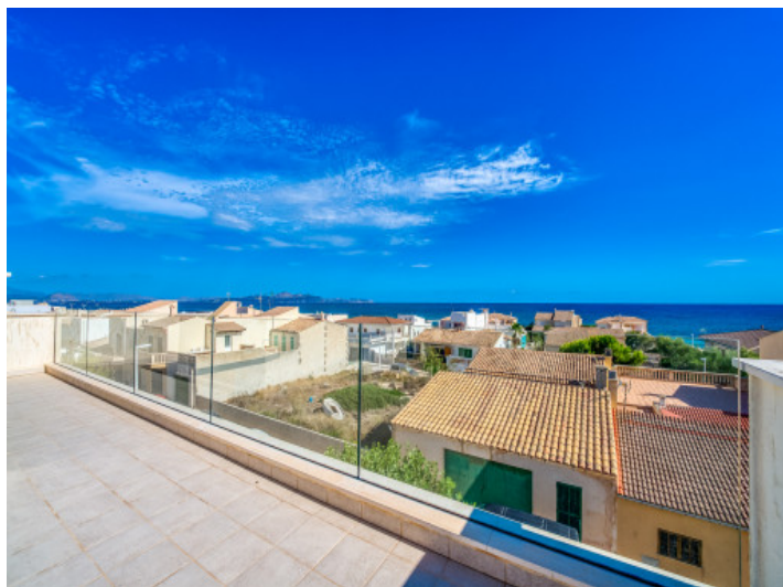
Vistas al mar