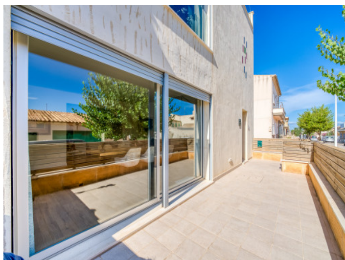
Terraza planta baja

Toda la información como mejor se puede saber, salvo por error durante el periodo de venta. Sirva este documento como un informe previo, las bases legales solo serán válidas a través de un contrato de compra acordado ante Notario.