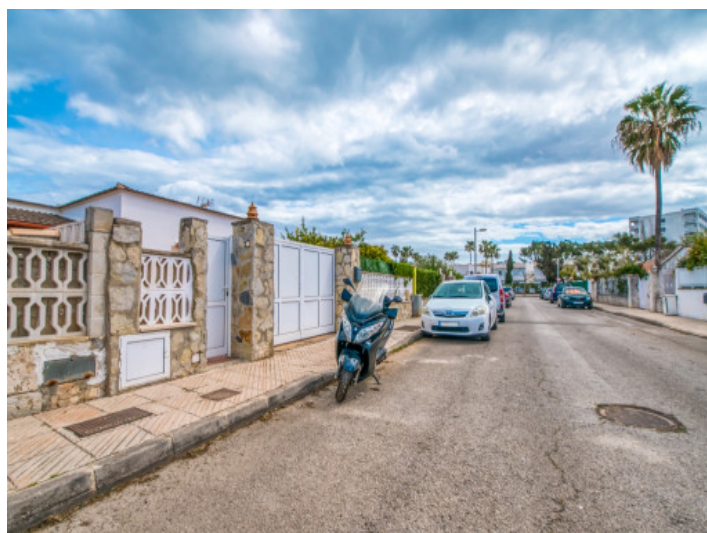
Vista de la calle