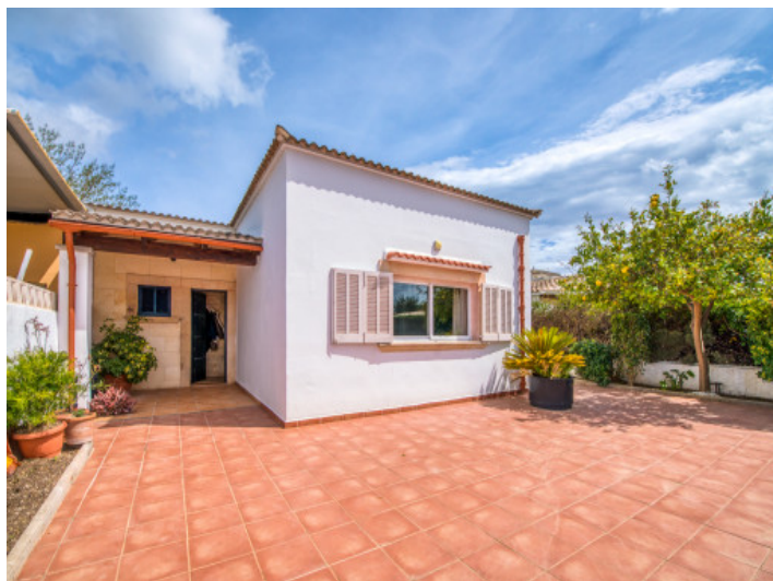
Vista exterior y acceso