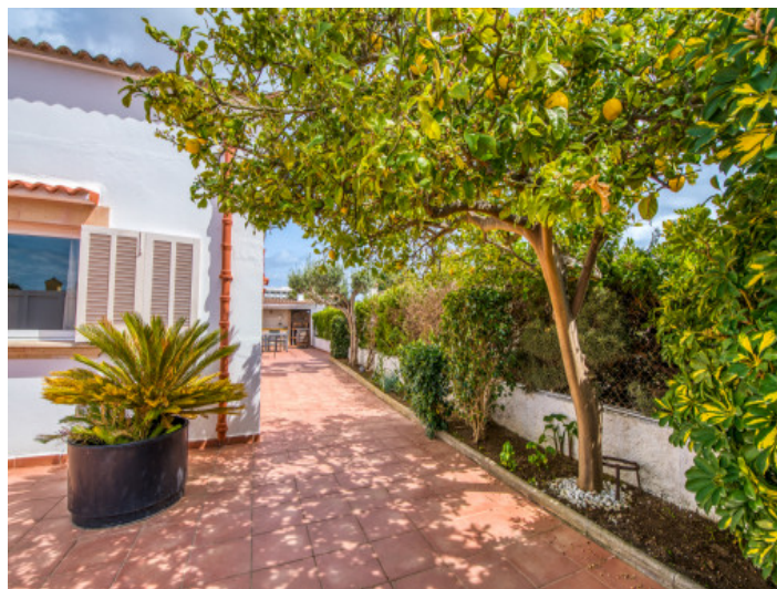
Terraza y plantas