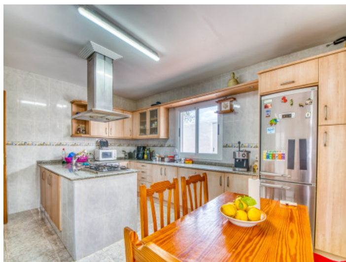
Cocina y comedor