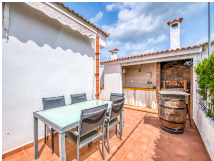
Área de barbacoa