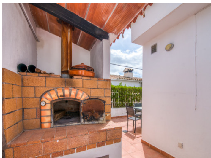
Horno de leña