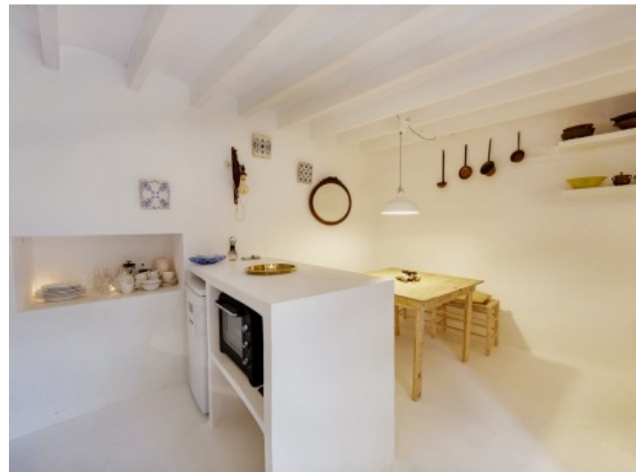
Comedor y cocina