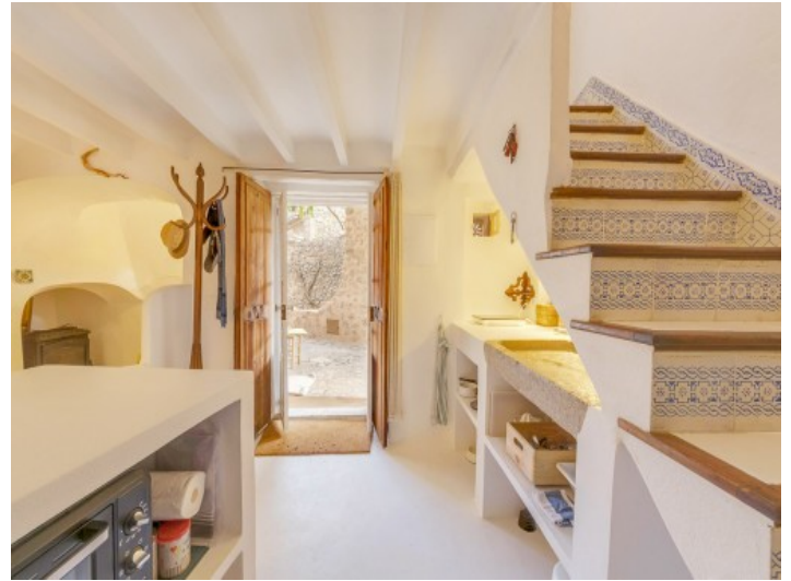
Entrada y cocina