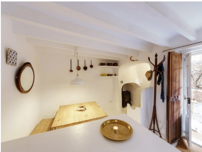
Comedor y cocina