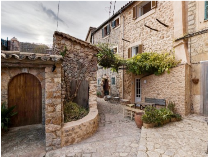
Vista exterior de la casa