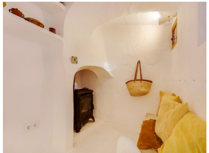
Zona de chimenea

Toda la información como mejor se puede saber, salvo por error durante el periodo de venta. Sirva este documento como un informe previo, las bases legales solo serán válidas a través de un contrato de compra acordado ante Notario.