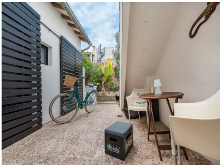
Hermoso patio con jardín