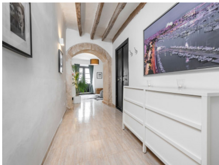
Corredor con un auténtico arco de piedra

Toda la información como mejor se puede saber, salvo por error durante el periodo de venta. Sirva este documento como un informe previo, las bases legales solo serán válidas a través de un contrato de compra acordado ante Notario.