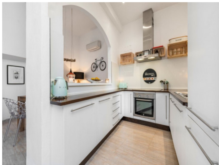
Cocina moderna y totalmente equipada