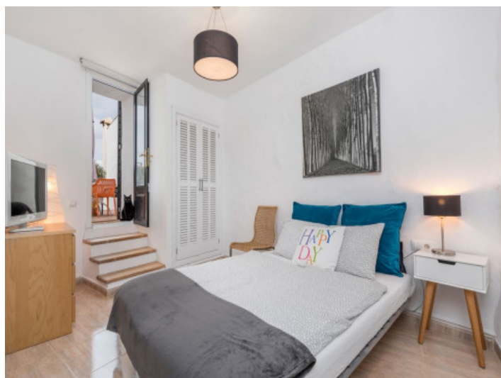
Dormitorio con acceso directo a la terraza