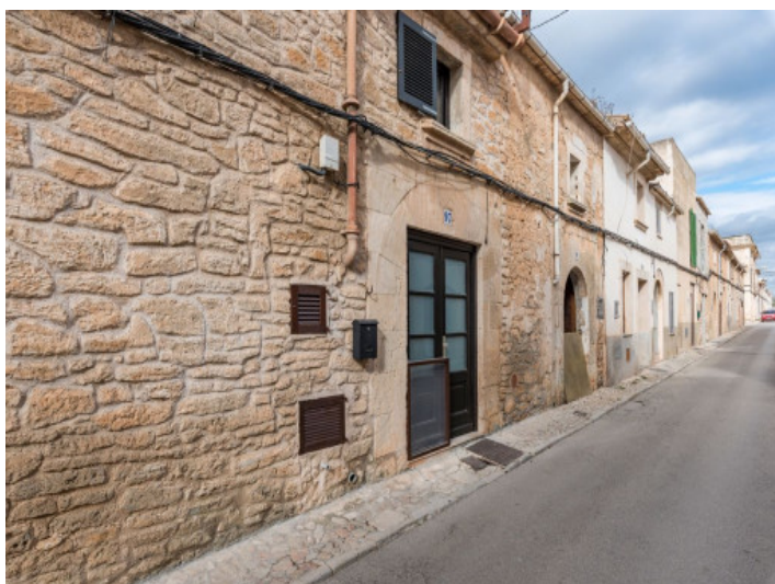
Vista exterior de la casa