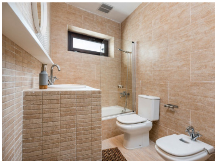
Baño moderno con bañera