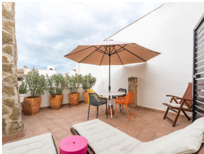
Amplia terraza en la planta superior