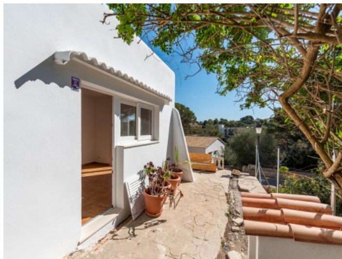
Acceso al chalet 2