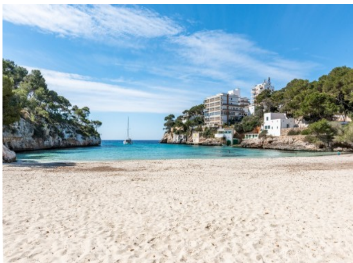
Playa de Cala Santanyi

Toda la información como mejor se puede saber, salvo por error durante el periodo de venta. Sirva este documento como un informe previo, las bases legales solo serán válidas a través de un contrato de compra acordado ante Notario.