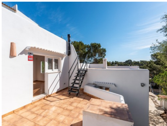
Acceso al chalet 1