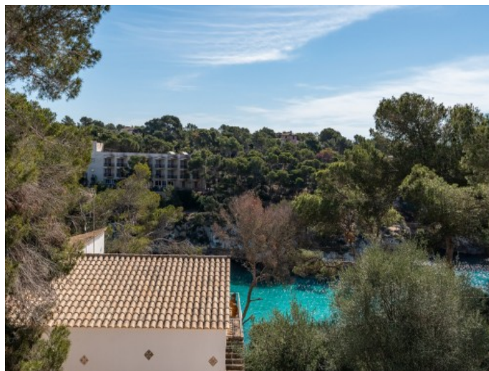
Vistas al mar