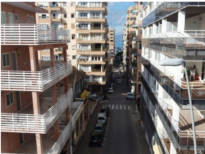
Vista de la calle