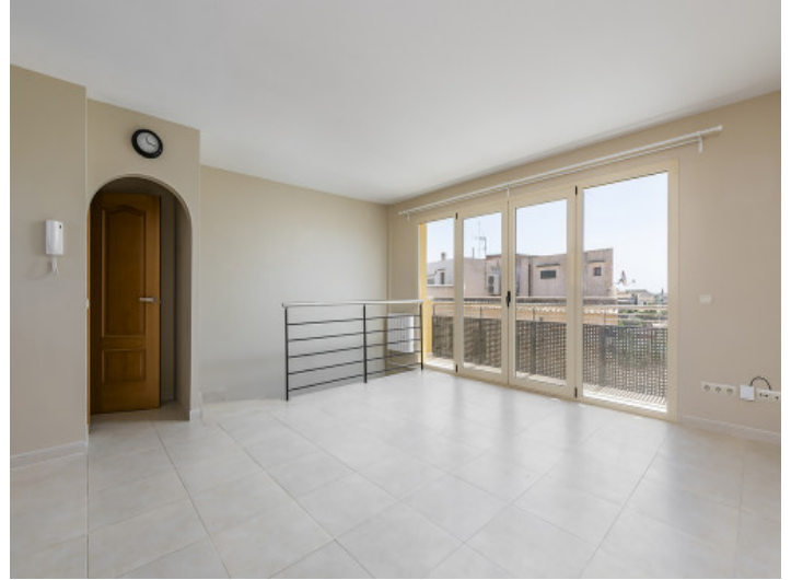
Salón-comedor en la planta superior