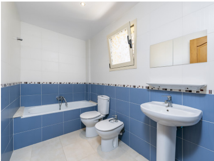
Uno de 2 baños