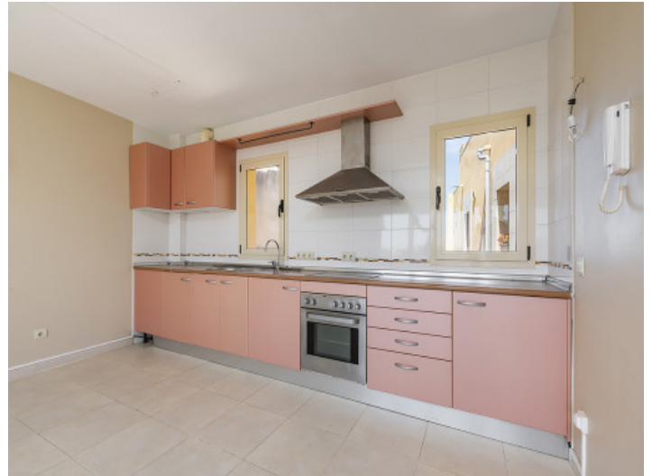
Cocina equipada y abierta