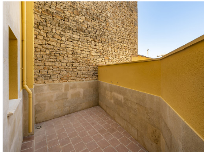
Patio en la planta baja