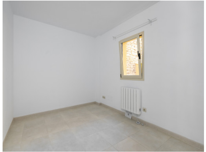
Uno de 3 dormitorios