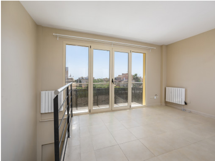
Acceso al balcón