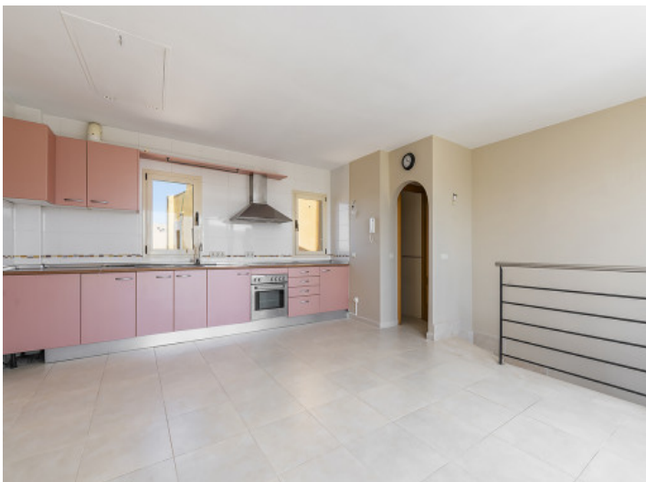
Nivel espacioso y luminoso