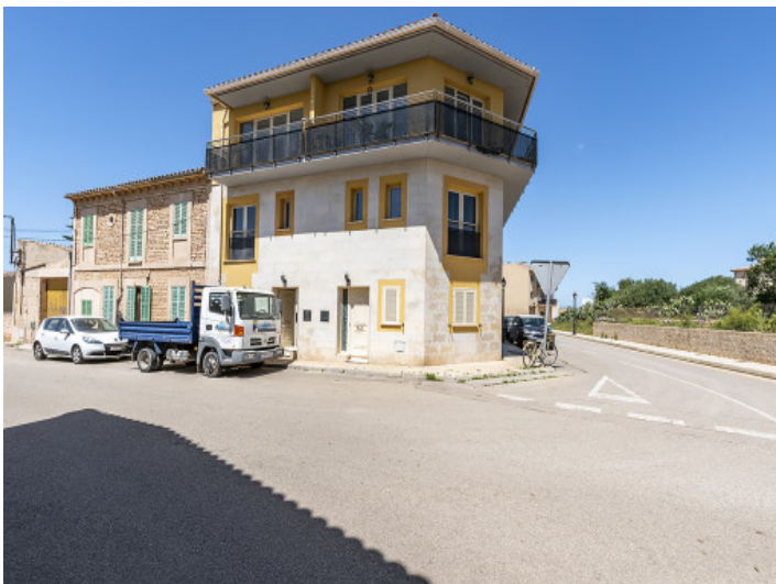
Vista exterior de la casa