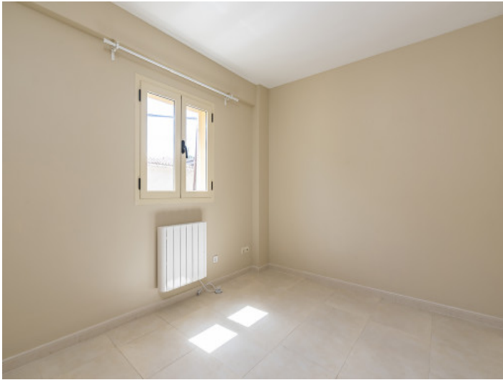
Uno de 3 dormitorios