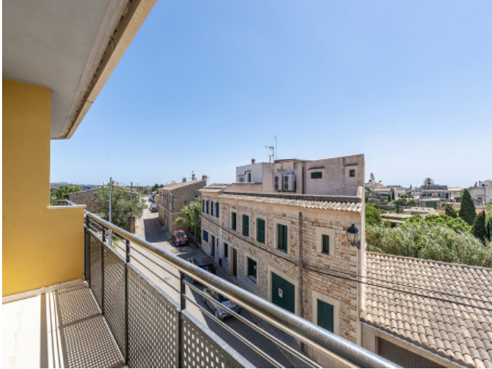
Vista desde el balcón