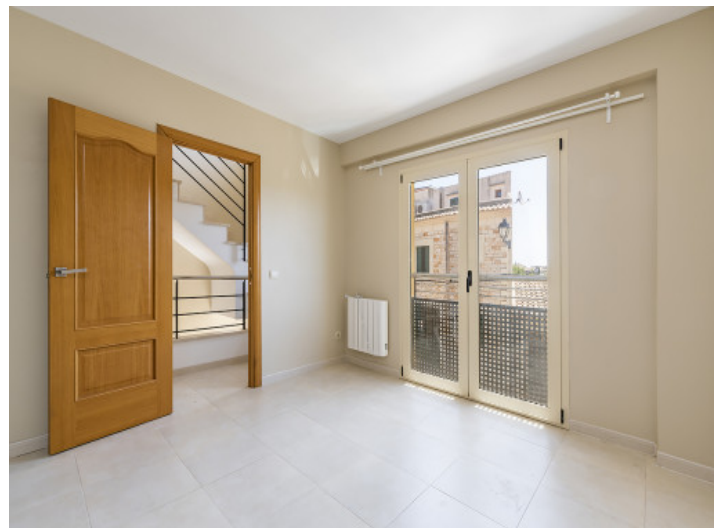
Uno de 3 dormitorios

Toda la información como mejor se puede saber, salvo por error durante el periodo de venta. Sirva este documento como un informe previo, las bases legales solo serán válidas a través de un contrato de compra acordado ante Notario.