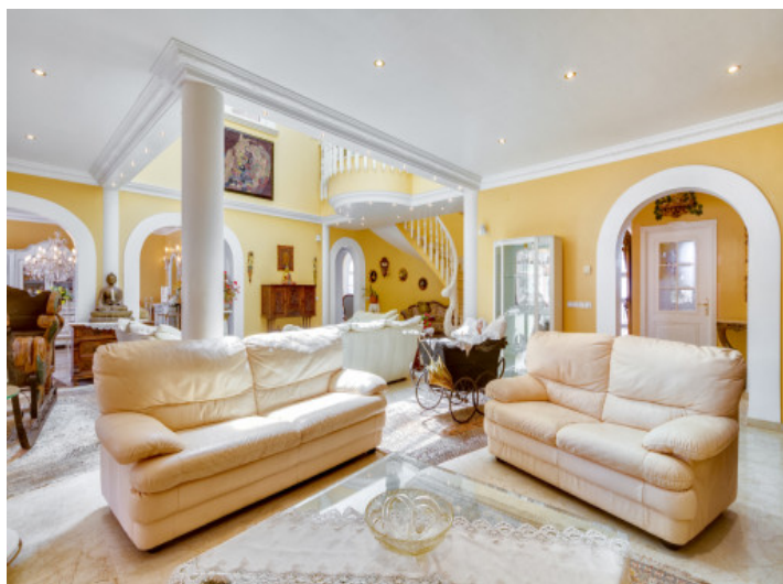
Varias zonas de estar en la sala de estar