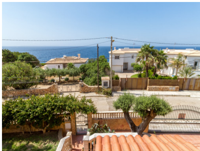
Vistas al mar desde el balcón