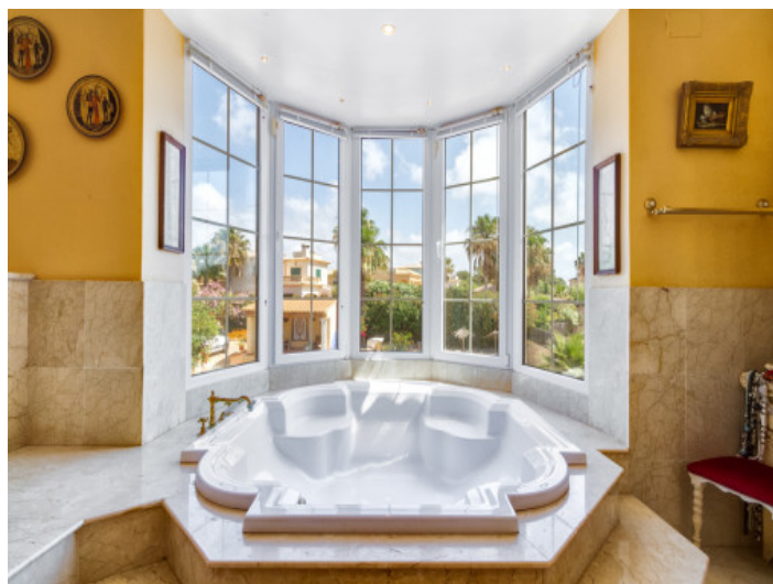
Baño noble con jacuzzi

Toda la información como mejor se puede saber, salvo por error durante el periodo de venta. Sirva este documento como un informe previo, las bases legales solo serán válidas a través de un contrato de compra acordado ante Notario.