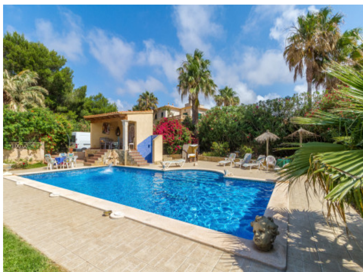
Soleada zona de la piscina y terraza