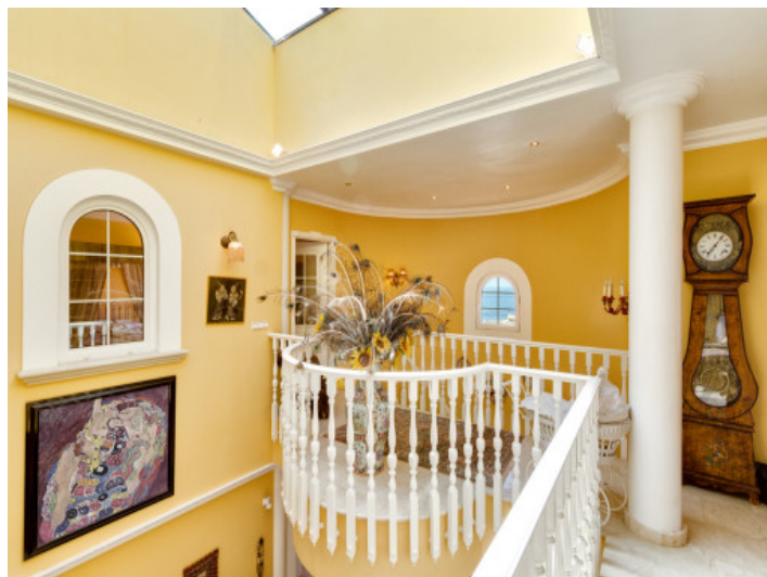
Vistas de la galería