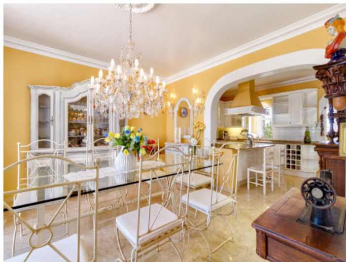
Comedor al lado de la cocina