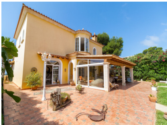
Vistas exteriores y jardín