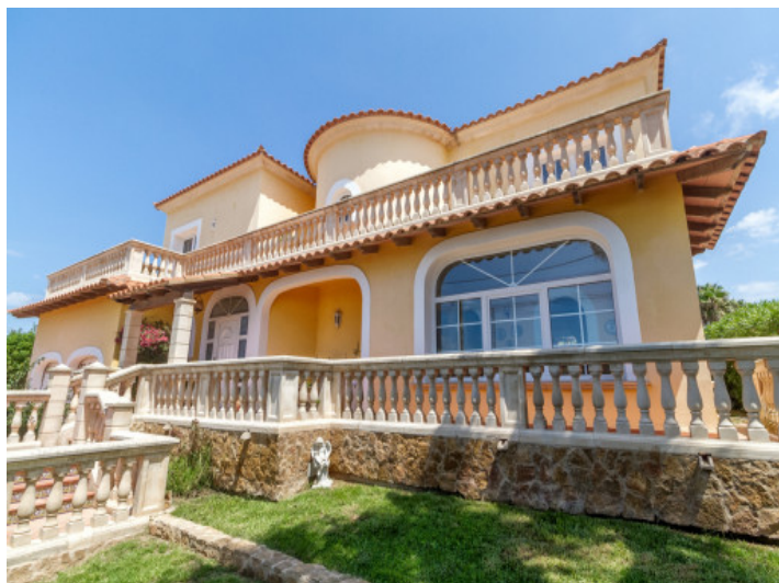
Vistas impresionantes de la propiedad