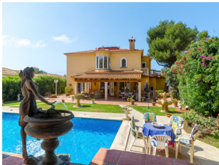
Atractivas tumbonas en la zona de la piscina