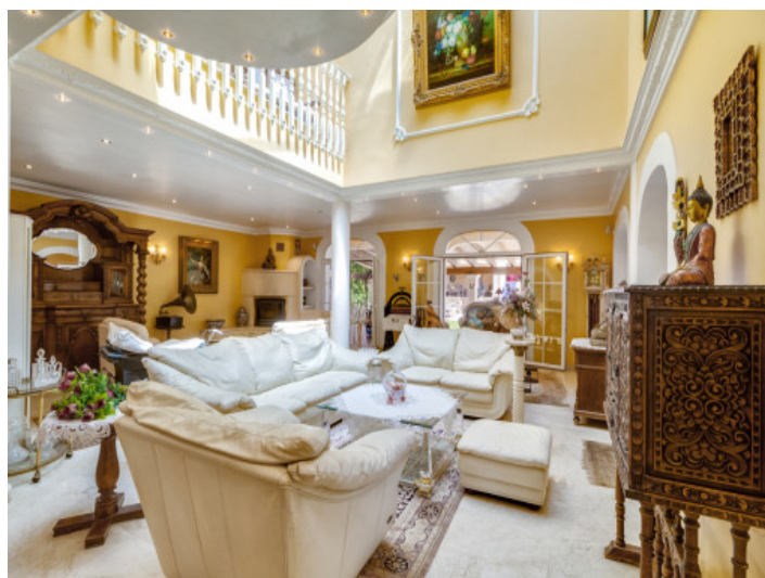
Sala de estar abierta y galería