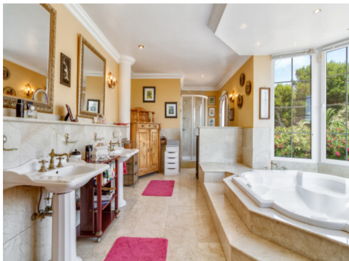
El baño está inundado de luz natural