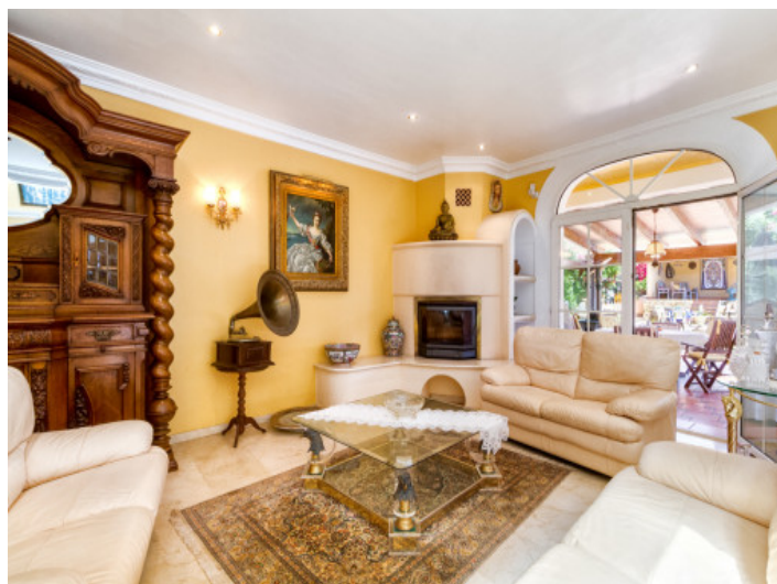
Acogedora chimenea en la zona de lounge

Toda la información como mejor se puede saber, salvo por error durante el periodo de venta. Sirva este documento como un informe previo, las bases legales solo serán válidas a través de un contrato de compra acordado ante Notario.