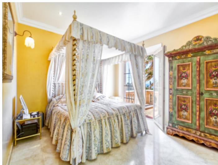
Dormitorio principal con acceso al balcón