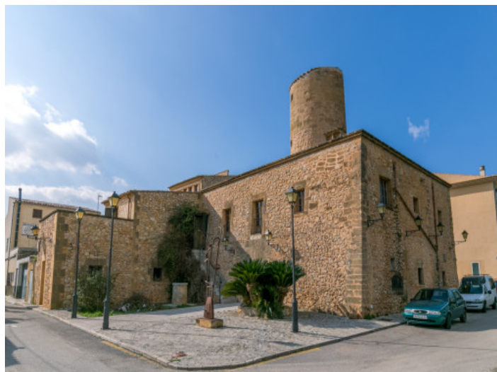
Vista exterior del molino

Toda la información como mejor se puede saber, salvo por error durante el periodo de venta. Sirva este documento como un informe previo, las bases legales solo serán válidas a través de un contrato de compra acordado ante Notario.