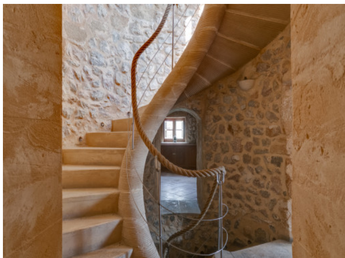
Vista alternativa del torre