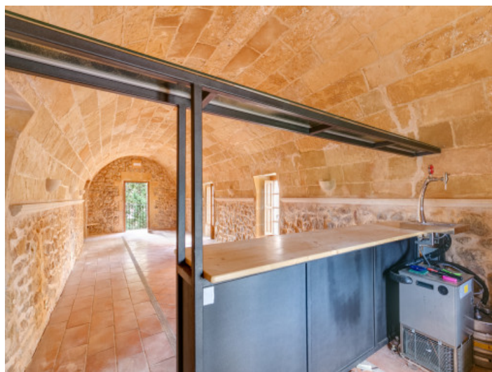
Un lugar excepcional y especial para un restaurante

Toda la información como mejor se puede saber, salvo por error durante el periodo de venta. Sirva este documento como un informe previo, las bases legales solo serán validas a traves de un contrato de compra acordado ante Notario.