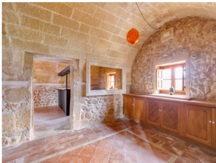
Otro espacio y zona con barra