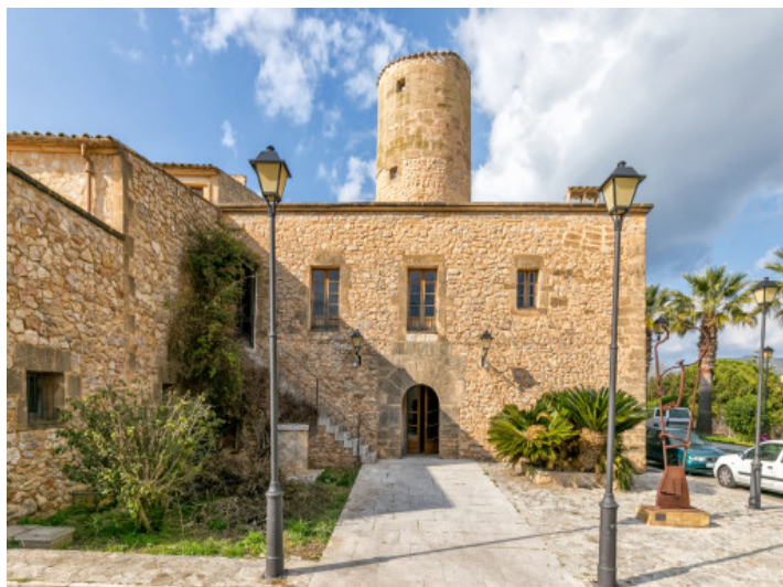
Vista exterior del molino