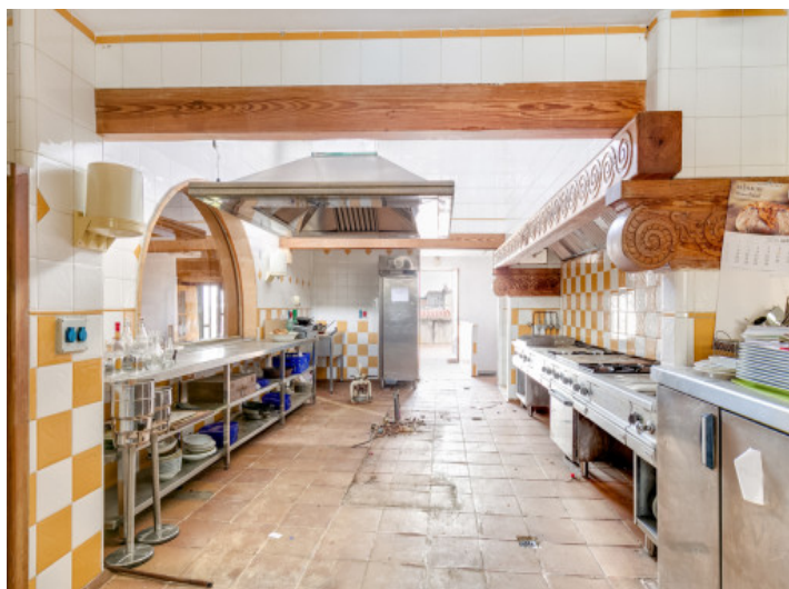
Espaciosa cocina de gastronomía