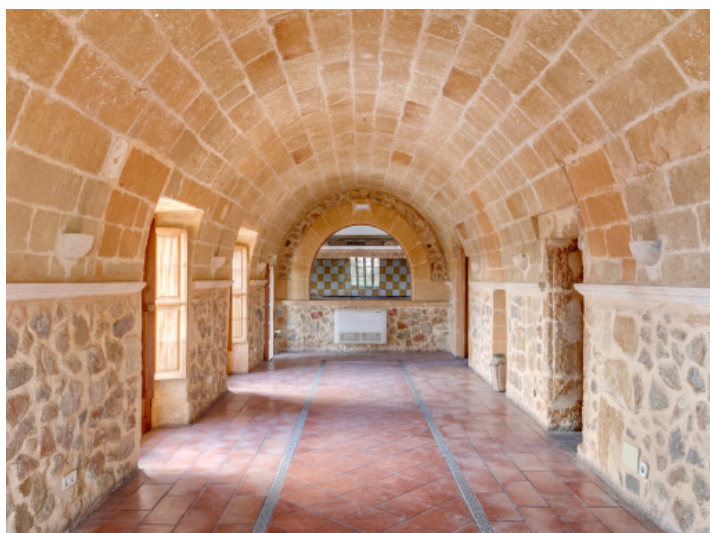
Espacio bonito con vistas a la cocina