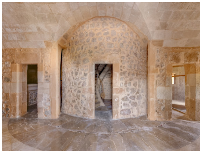
El inmueble se puede convertir también en una propiedad residencial

Toda la información como mejor se puede saber, salvo por error durante el periodo de venta. Sirva este documento como un informe previo, las bases legales solo serán aplicables tras la firma de un contrato de compra acordado ante Notario.