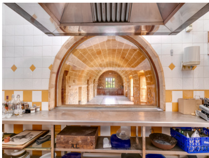
Vistas fantásticas desde la cocina al espacio