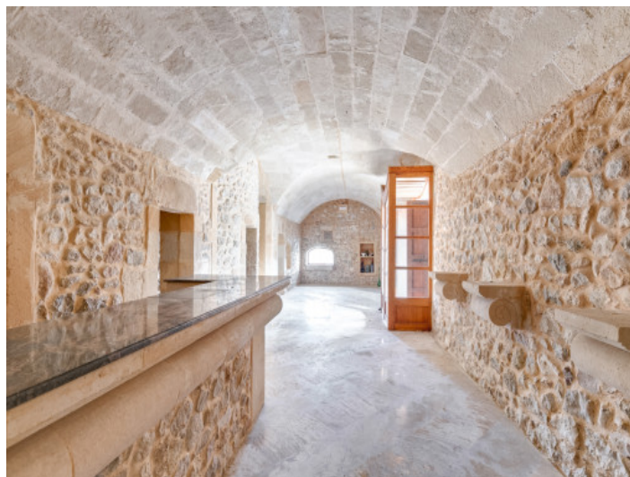
Área de entrada muy impresionante