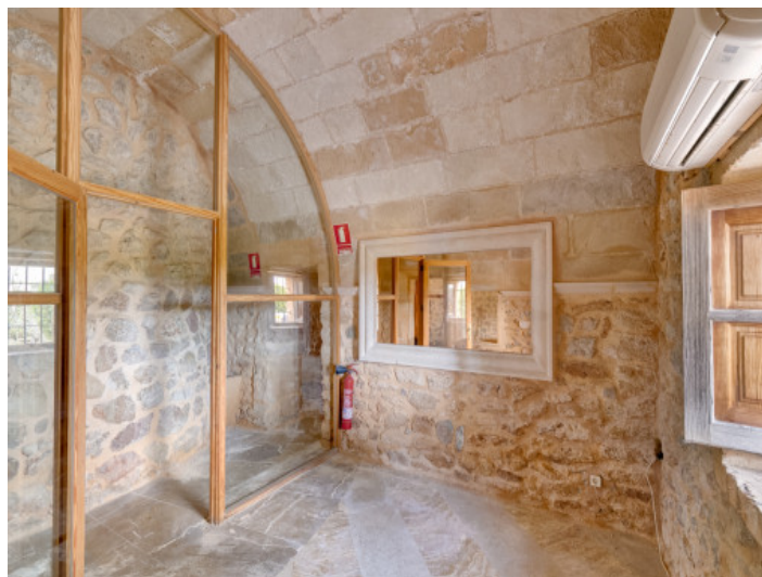
Trastero con aire acondicionado