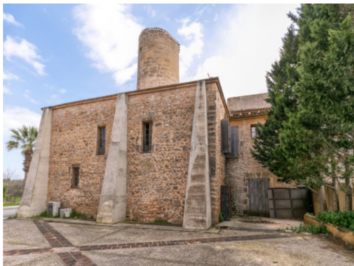
En el exterior hay suficientes opciones de asientos