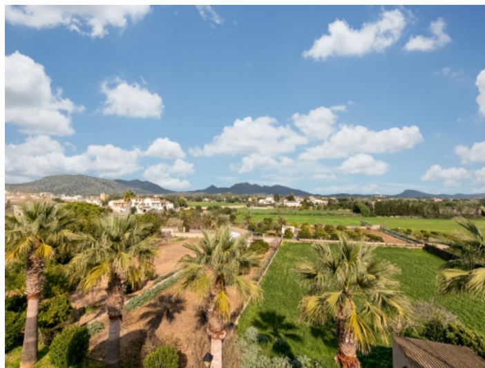
Magníficas vistas panorámicas desde la zotea