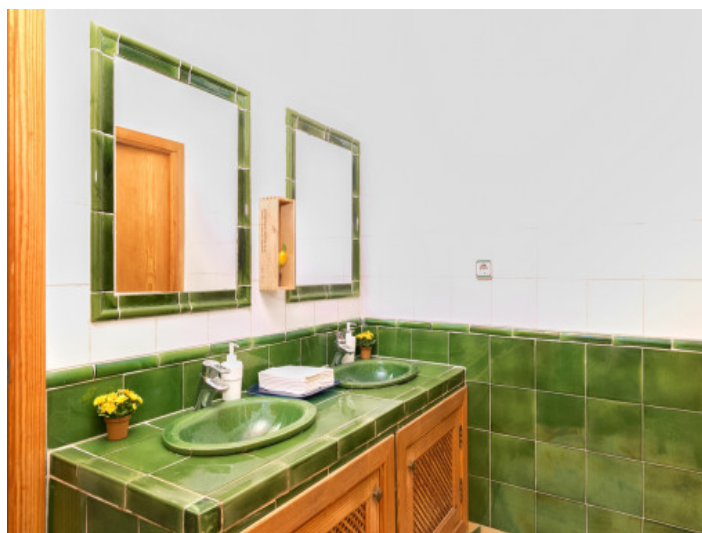
Cuarto de aseo con lavabo doble