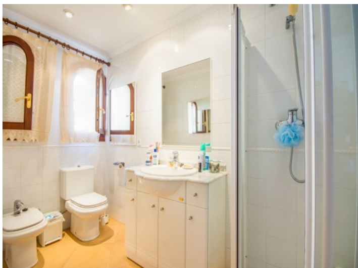
Baño con ducha y luz natural