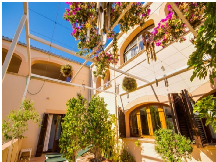
Patio con vistas a la propiedad