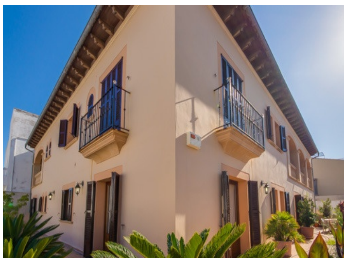
Vistas a la fachada

Toda la información como mejor se puede saber, salvo por error durante el periodo de venta. Sirva este documento como un informe previo, las bases legales solo serán válidas a través de un contrato de compra acordado ante Notario.