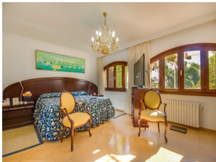
Dormitorio inundado de luz