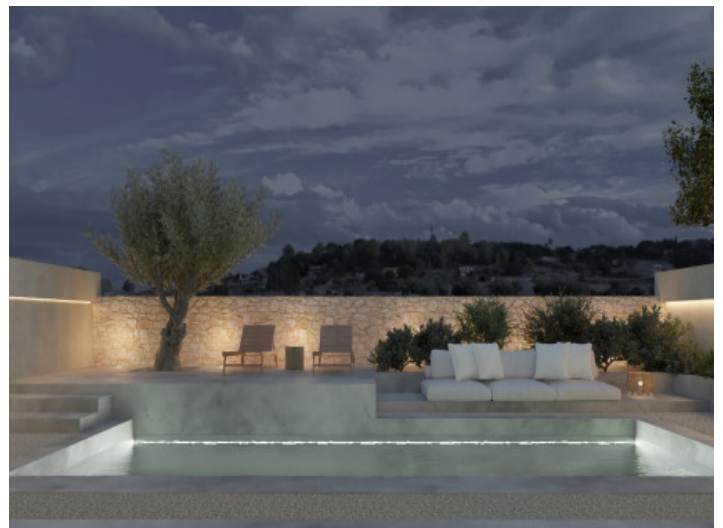
Terraza de noche

Toda la información como mejor se puede saber, salvo por error durante el periodo de venta. Sirva este documento como un informe previo, las bases legales solo serán válidas a través de un contrato de compra acordado ante Notario.