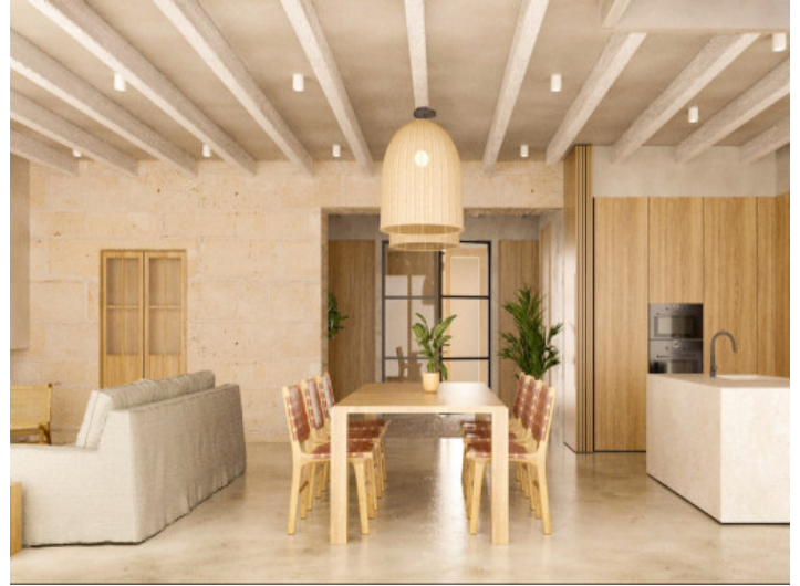
Salon y comedor