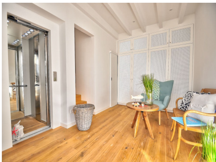
Recibidor con ascensor