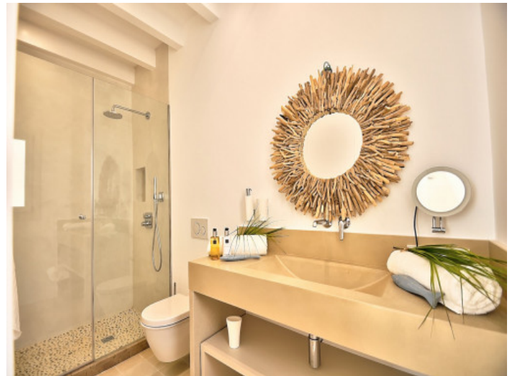
Baño planta baja

Toda la información como mejor se puede saber, salvo por error durante el periodo de venta. Sirva este documento como un informe previo, las bases legales solo serán validas a traves de un contrato de compra acordado ante Notario.