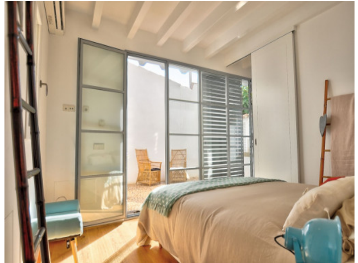
Dormitorio planta baja