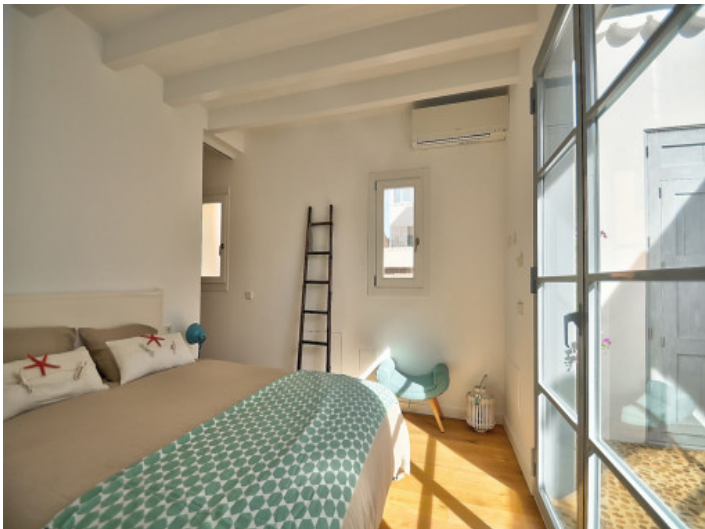
Dormitorio planta baja