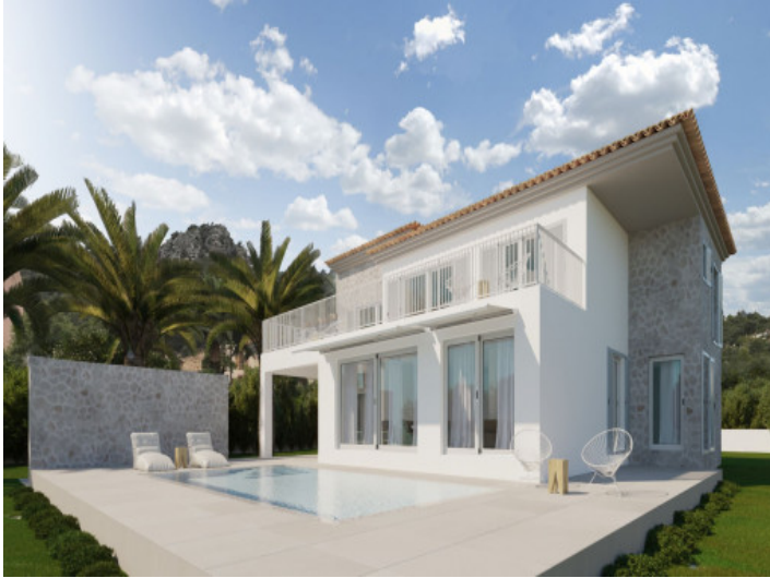
Villa con piscina