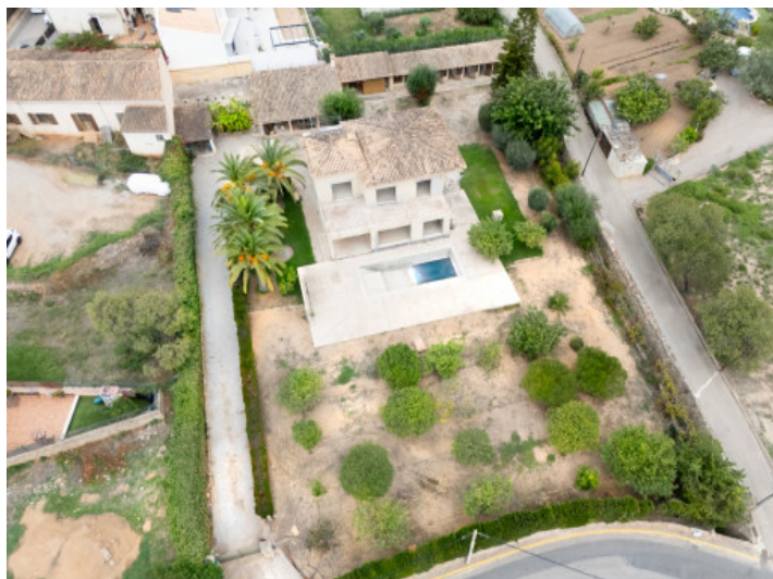
Villa y terreno