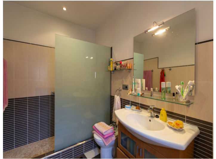
Uno de 2 baños