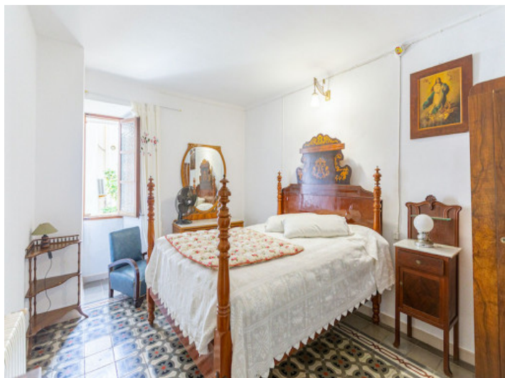
Uno de 5 dormitorios