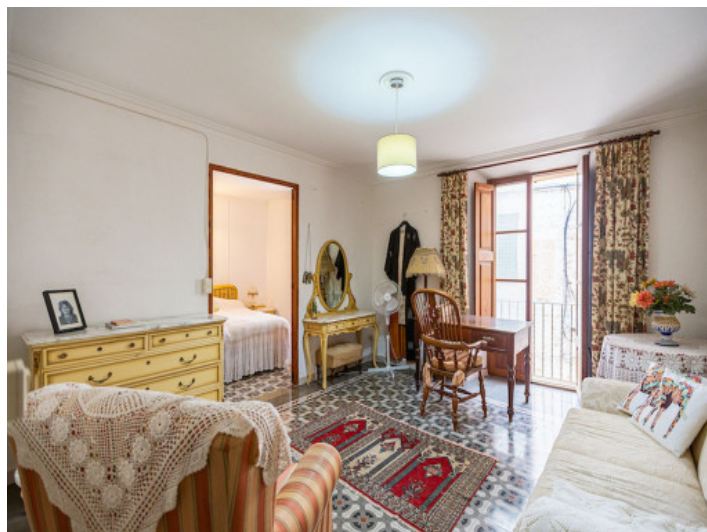
Salita primera planta