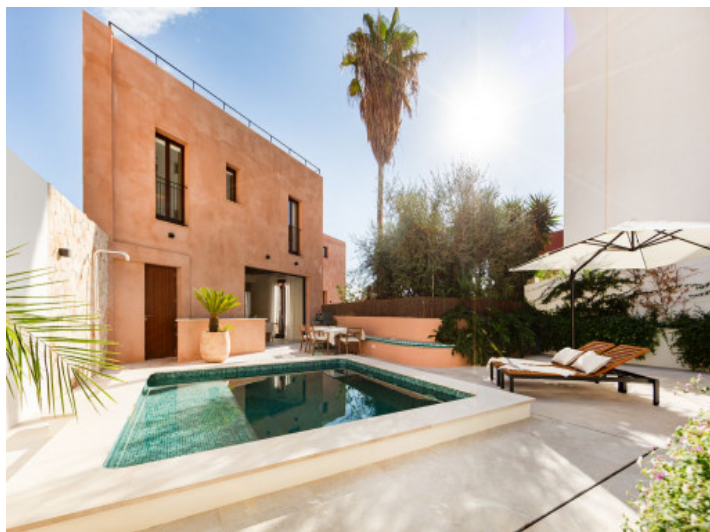
Piscina y fachada