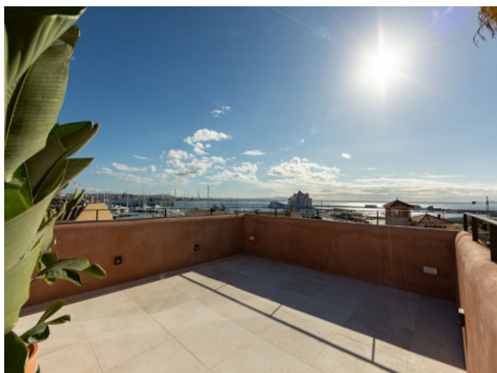
Azotéa con vistas al mar