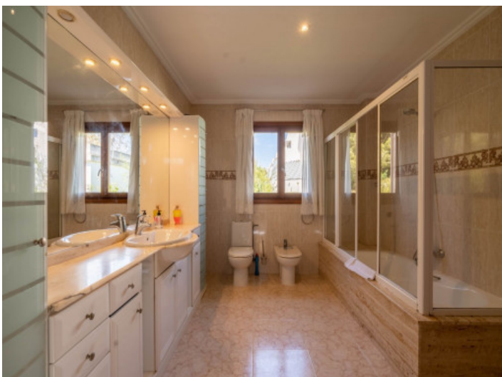
Uno de 3 baños