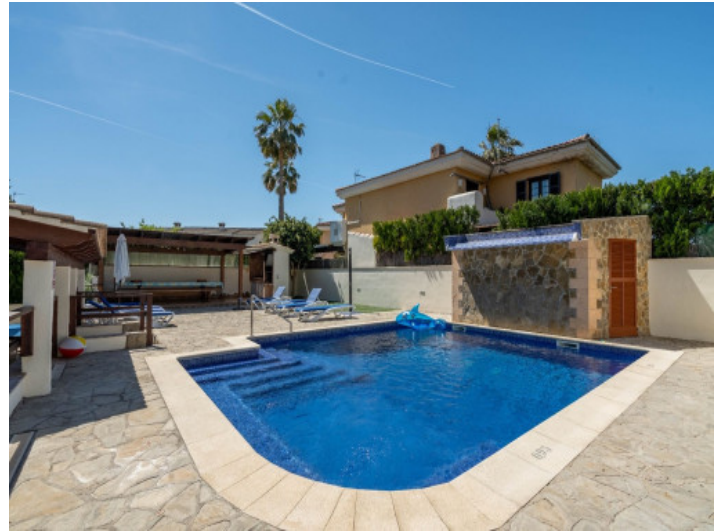
Espaciosa zona de piscina