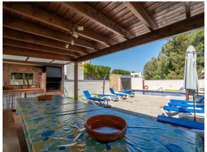
Terraza cubierta con zona de barbacoa