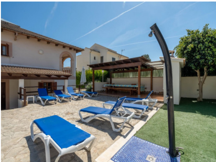
Terraza soleada con ducha exterior