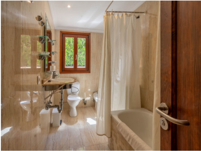
Uno de 3 baños