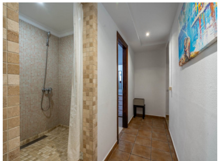
Uno de 3 baños

Toda la información como mejor se puede saber, salvo por error durante el periodo de venta. Sirva este documento como un informe previo, las bases legales solo serán válidas a través de un contrato de compra acordado ante Notario.