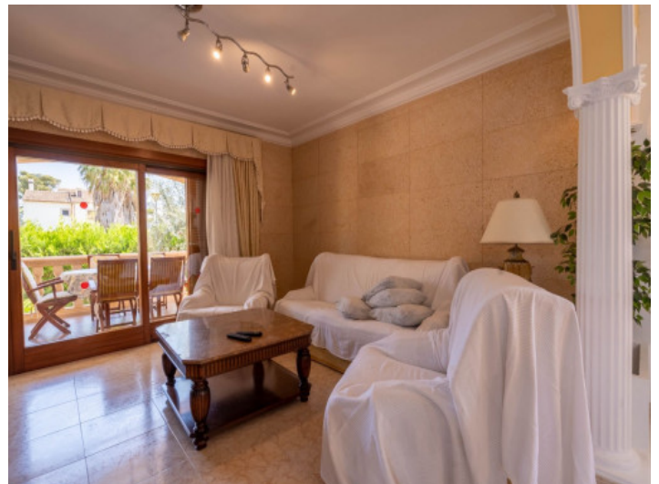
Salón con acceso a la terraza