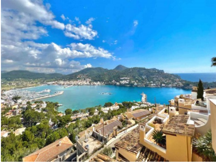
Vista al puerto