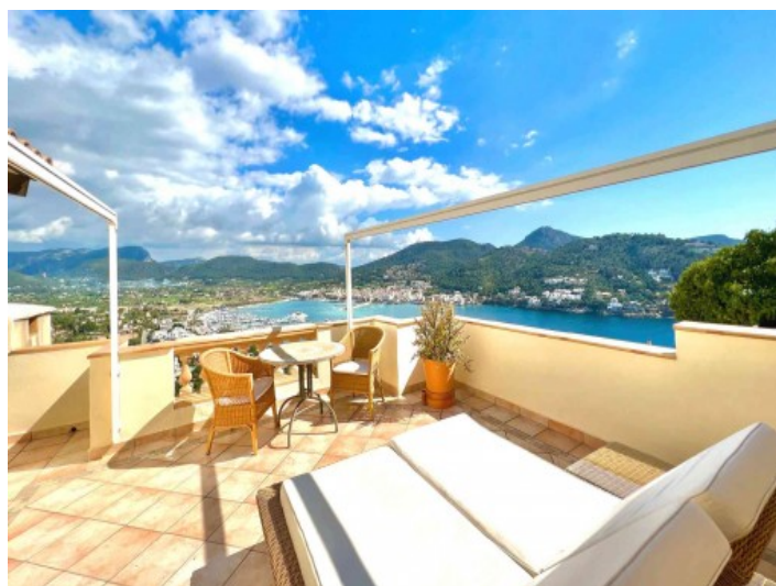
Azotea con una vista

Toda la información como mejor se puede saber, salvo por error durante el periodo de venta. Sirva este documento como un informe previo, las bases legales solo serán válidas a través de un contrato de compra acordado ante Notario.