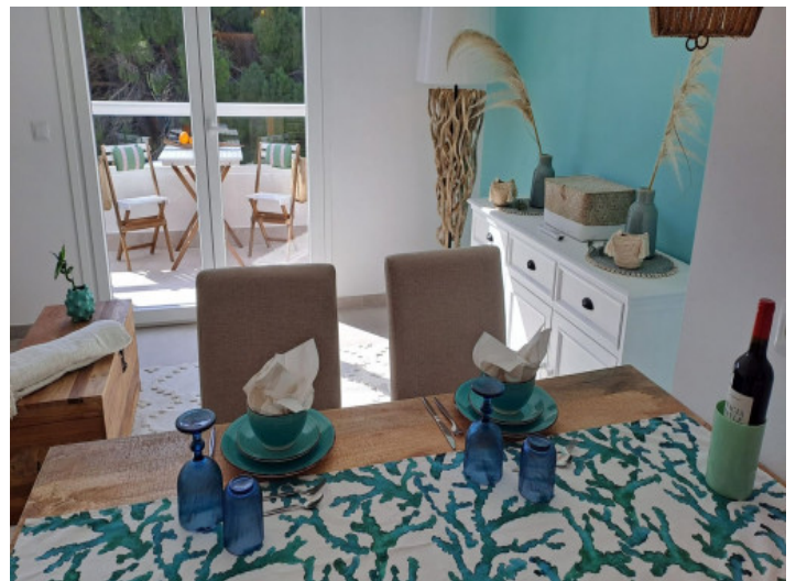
Sala de estar y comedor de planta abierta

Toda la información como mejor se puede saber, salvo por error durante el periodo de venta. Sirva este documento como un informe previo, las bases legales solo serán válidas a través de un contrato de compra acordado ante Notario.