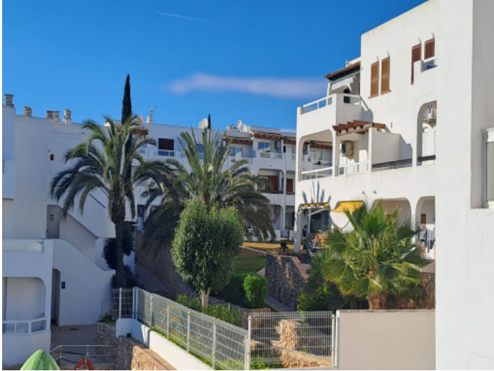
Complejo residencial mediterráneo