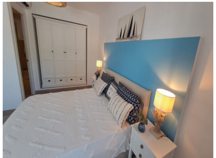
Dormitorio con armario empotrado

Toda la información como mejor se puede saber, salvo por error durante el periodo de venta. Sirva este documento como un informe previo, las bases legales solo serán válidas a través de un contrato de compra acordado ante Notario.