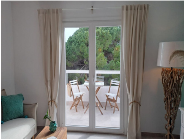
Salón con acceso al balcón