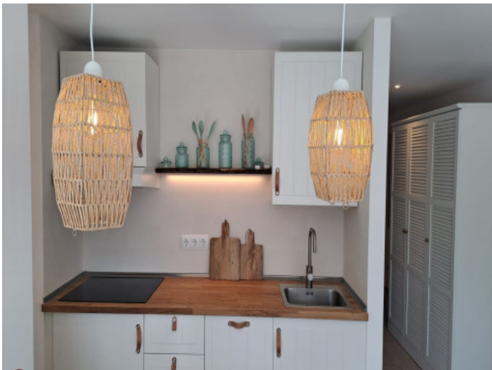
Cocina totalmente equipada