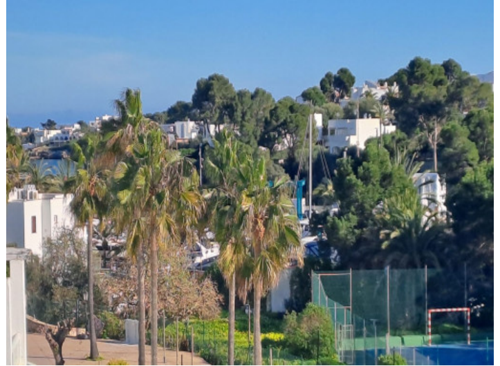
A poca distancia del puerto de Cala d'Or