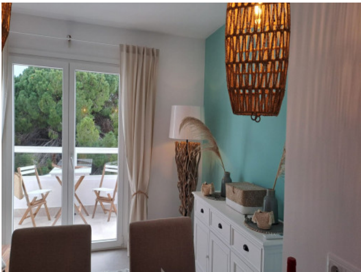
Sala de estar y comedor