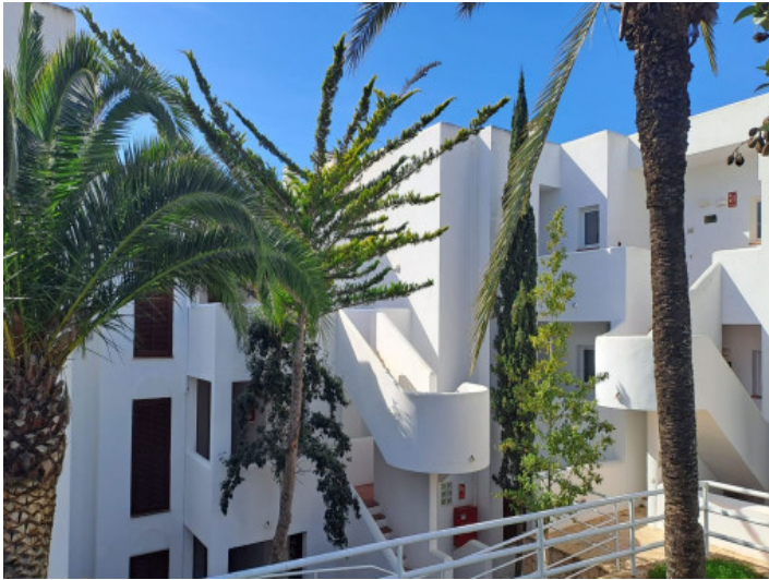
Complejo residencial bien cuidado