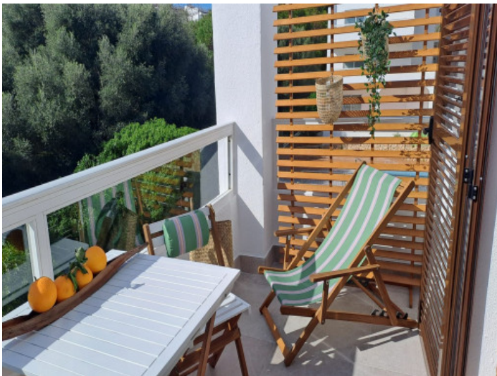
Balcón orientado al sur