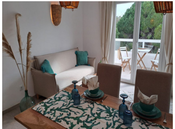
Acogedora sala de estar