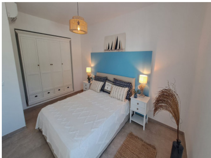
Cama doble grande