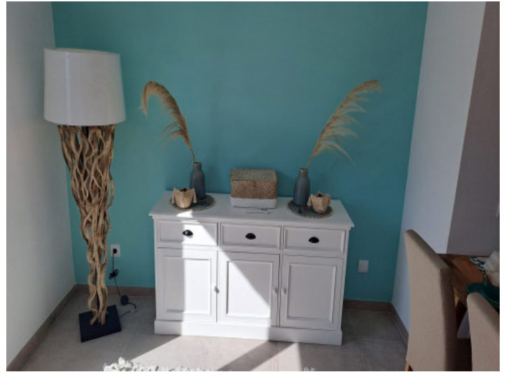
Piso amueblado con cariño