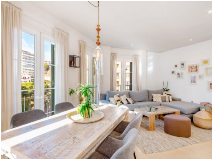
Comedor y salón