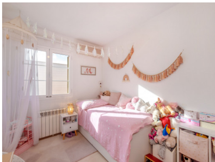
Cuarto de los niños

Toda la información como mejor se puede saber, salvo por error durante el periodo de venta. Sirva este documento como un informe previo, las bases legales solo serán válidas a través de un contrato de compra acordado ante Notario.