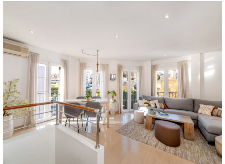
Salón y comedor

Toda la información como mejor se puede saber, salvo por error durante el periodo de venta. Sirva este documento como un informe previo, las bases legales solo serán válidas a través de un contrato de compra acordado ante Notario.