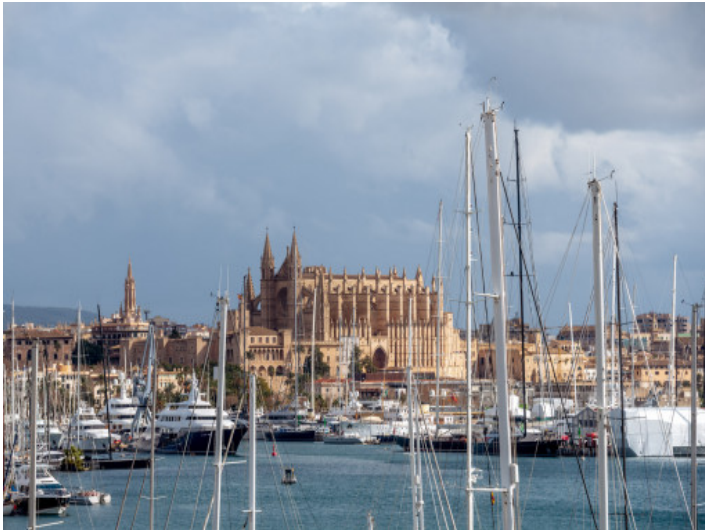
Vistas a la Seu