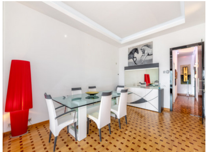
Salón y comedor

Toda la información como mejor se puede saber, salvo por error durante el periodo de venta. Sirva este documento como un informe previo, las bases legales solo serán válidas a través de un contrato de compra acordado ante Notario.