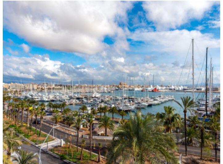
Vistas al puerto