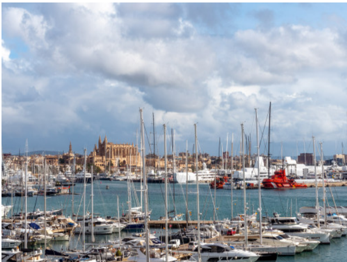
Vistas al puerto y a la catedral