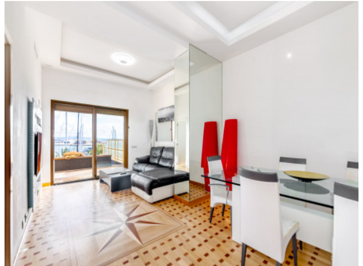
Salón y comedor