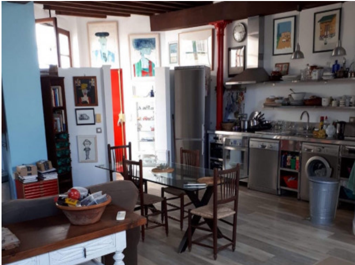
Cocina y comedor