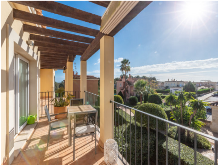
Terraza con vistas