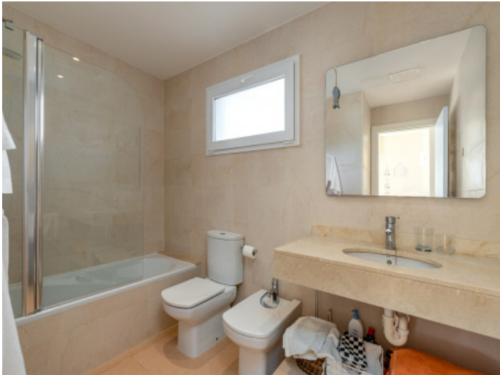
Uno de 2 baños