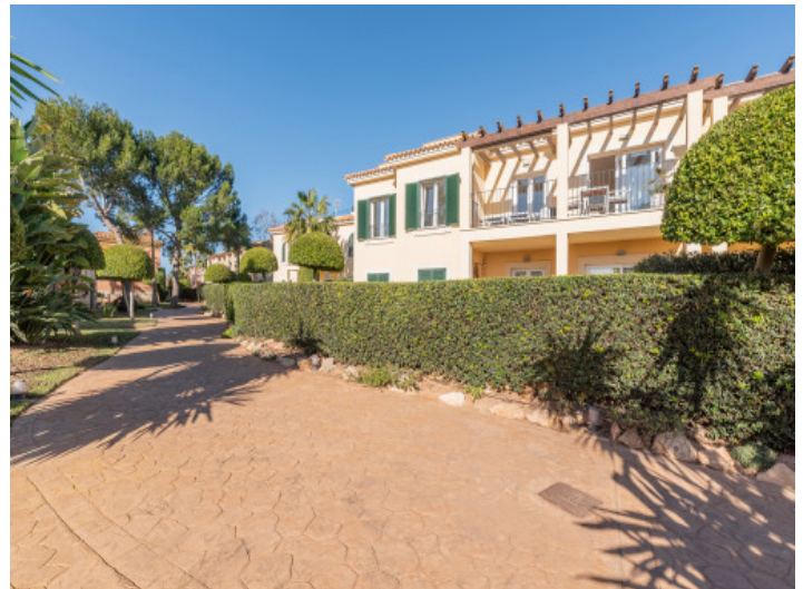
Fachada y jardín

Toda la información como mejor se puede saber, salvo por error durante el periodo de venta. Sirva este documento como un informe previo, las bases legales solo serán válidas a través de un contrato de compra acordado ante Notario.