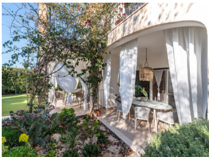
Terraza y jardín