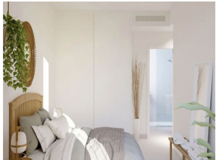
Uno de 2 dormitorios