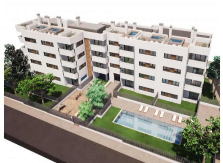
Jardín con piscina

Toda la información como mejor se puede saber, salvo por error durante el periodo de venta. Sirva este documento como un informe previo, las bases legales solo serán válidas a través de un contrato de compra acordado ante Notario.