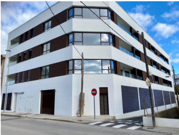
El edificio hace esquina