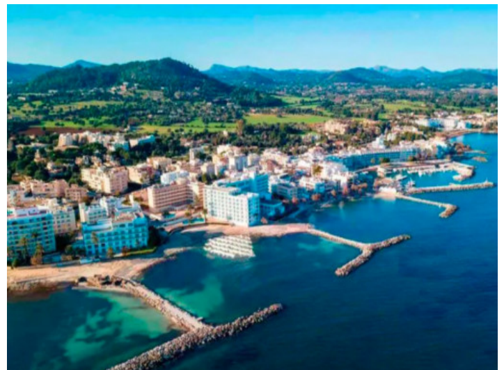
Vista de pájaro

Toda la información como mejor se puede saber, salvo por error durante el periodo de venta. Sirva este documento como un informe previo, las bases legales solo serán válidas a través de un contrato de compra acordado ante Notario.