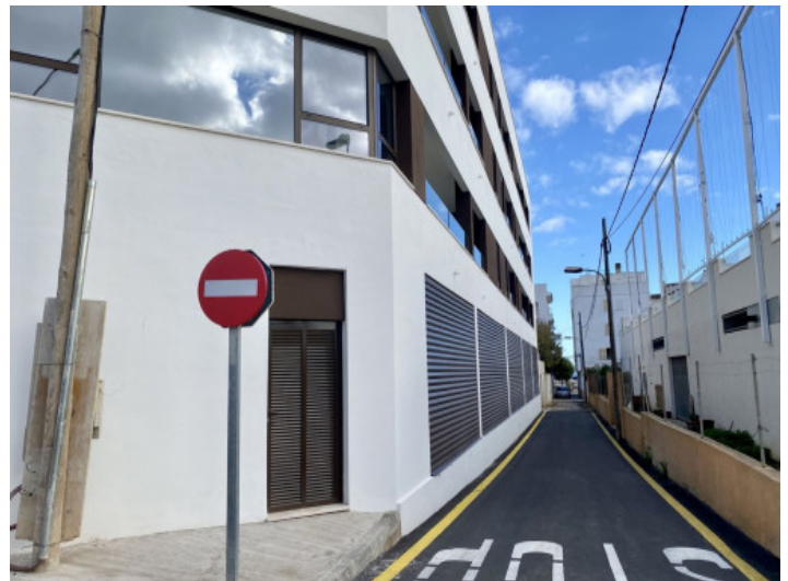
El edificio hace esquina