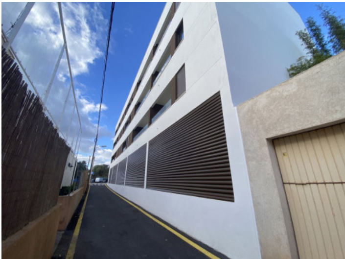
El edificio hace esquina