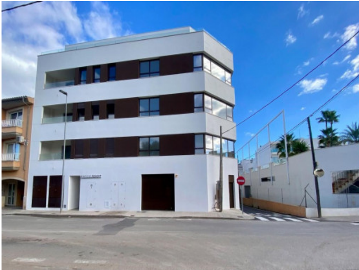
Vista al edificio