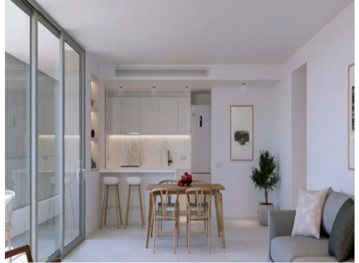
Piso con 2 dormitorios y 2 baños