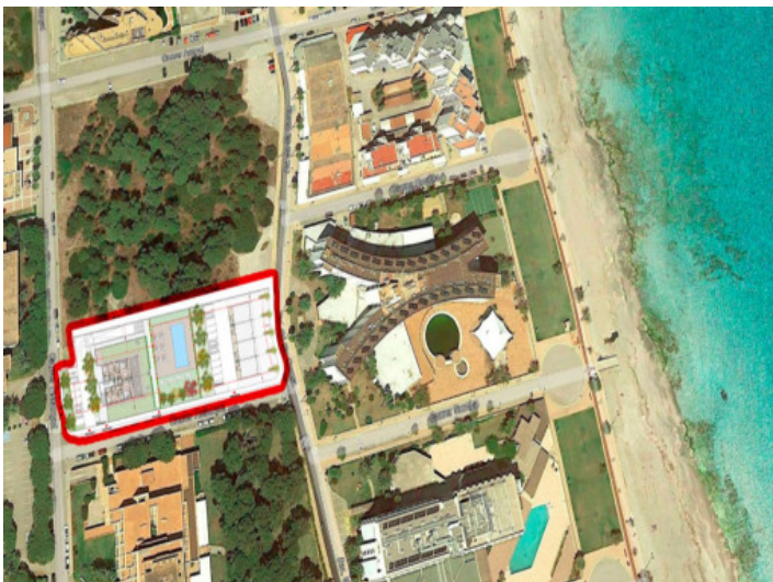
Cerca de la playa