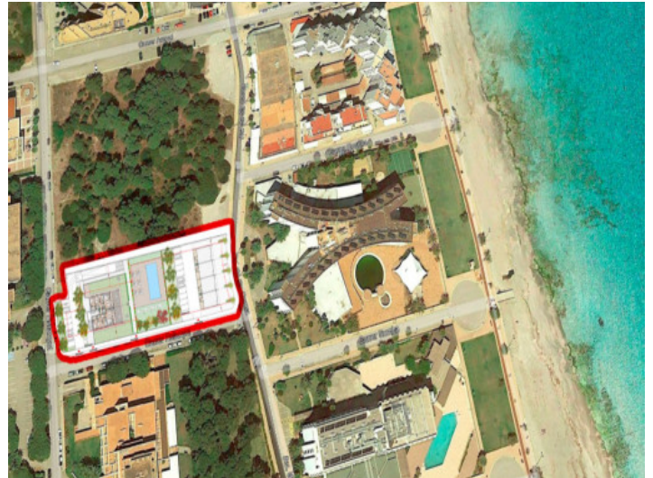
Cerca de la playa