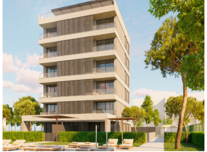
Parking y trastero