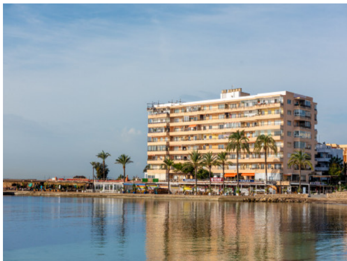
Ubicado a pie de playa