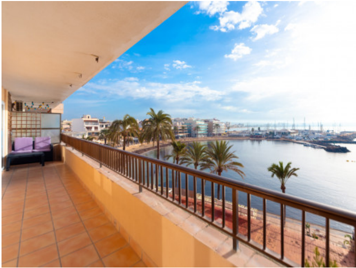
Balcón con vistas al mar