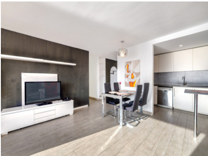
Piso con mucha luz