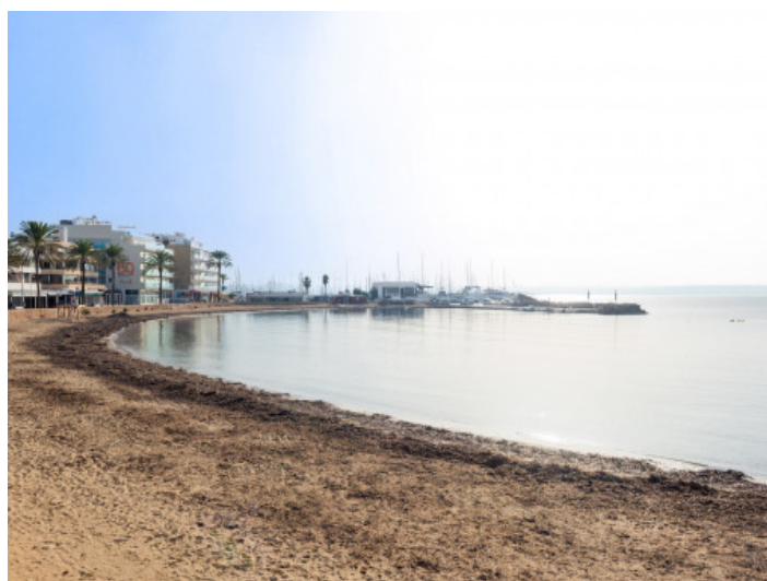
La playa se situa a pie del edificio

Toda la información como mejor se puede saber, salvo por error durante el periodo de venta. Sirva este documento como un informe previo, las bases legales solo serán válidas a través de un contrato de compra acordado ante Notario.