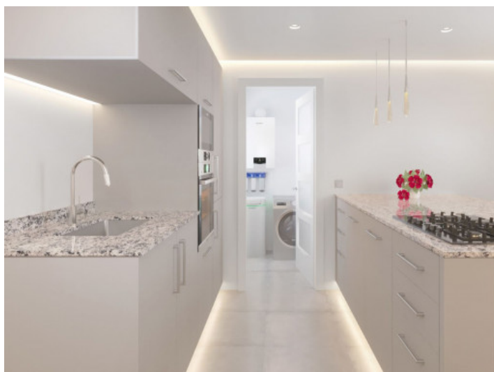
Cocina moderna y galería