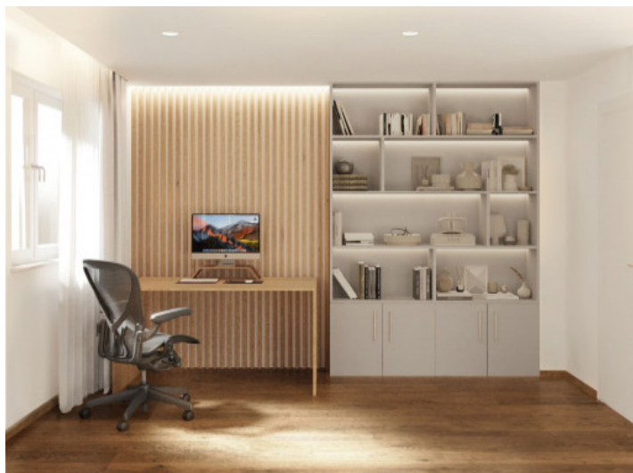
Despacho o dormitorio