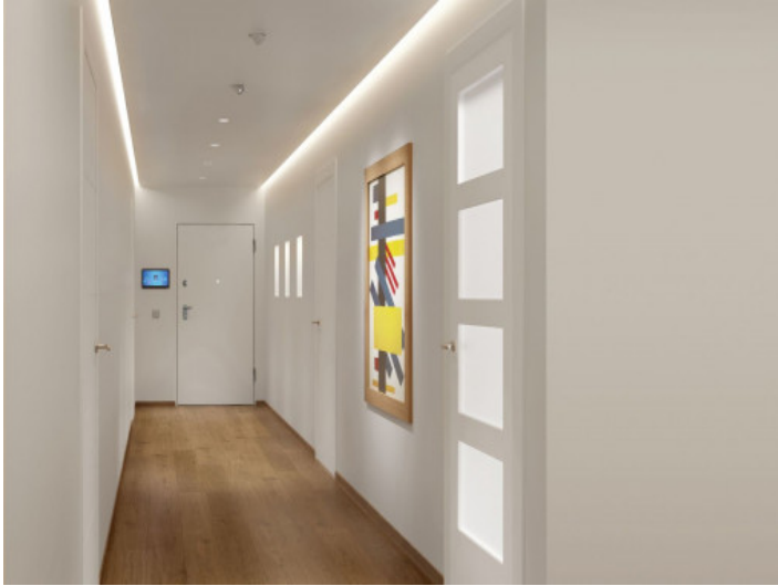
Entrada y pasillo