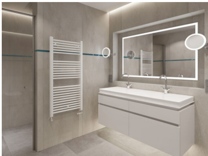
Baño dormitorio principal