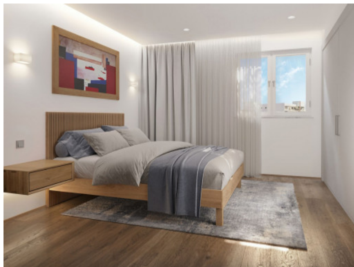
Uno de 3 dormitorios