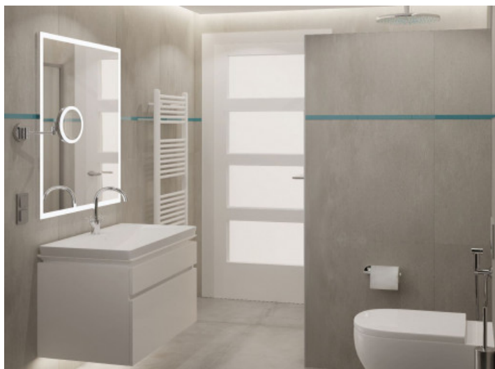
Baño con ducha