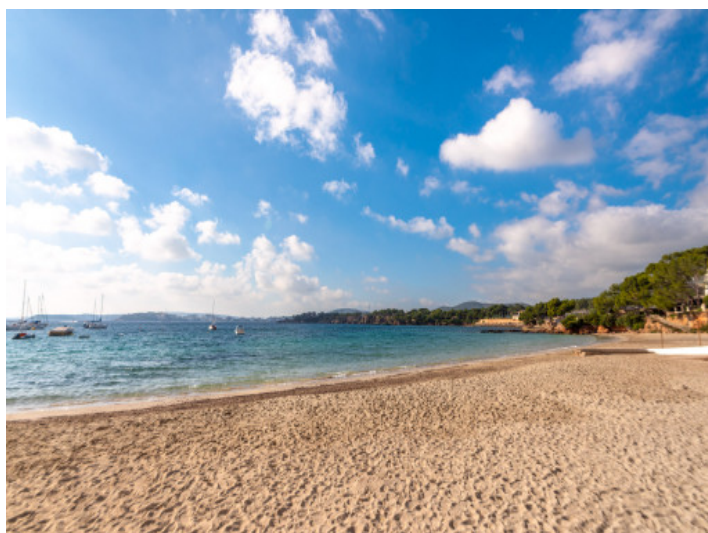
Playa en la cercanía